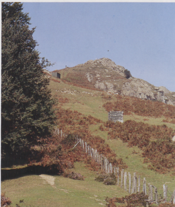
■ Galtzarrietako gaina Burnaiztieta lepotik

Marka zuri gorriak jarraituz (GR 121), bide erosoak Bianditzeko lepora garamatza, barrutitik urrutiratuz. Beraz, Artikutzako barrutia mugatzen duen alanbrezko hesia erreferentzi gisa hartuz, honen paraleloan segi eta aldapa pikoia jaitsiko dugu. Laster izango gara Artikutzako sarrera adierazten duen kartelaren ondoan, baina metro batzuk lehenago zintzurra freskatzeko iturri bikain batekin egingo dugu topo. Errepidean barna aurrera segituz, berehala helduko gara atezaindegira.