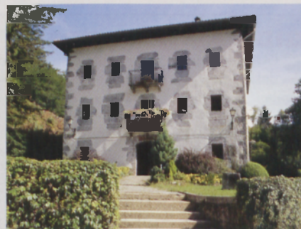
■ Artikutza herrian, Olajaundi izeneko etxea

Urtean behin, San Agustin egunaren inguruan, Orreagatik Artikutzara joaten ziren nagusiak, bertakoei errentak kobratzeko. Gaur egun, berriz, abuztuaren 28an, San Agustin egunean hain zuzen ere, Artikutzan jai giroa nagusitzen da. Egun horretan ateak zabaltzen dira nahi duenak bertara joateko, baimenik eskatu gabe. Urte osoko isiltasuna apurtzen da eta festa giroa nagusitzen da.