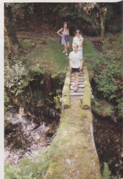
■ Urdallue erreka gainditzeko zubia

Baserri-multzoa utzi eta sakanaren ezker aldeko mendialdetik doan bide zabala hartuko dugu. Berehala, Lapurzulo izenez ezaguna den meatzal ingurura iritsiko gara eta aurrerago, garai batean Ollagarate errekatik Lizarrurdiñetako deposituraino ura garraiatzen zuen ubide bat aurkituko dugu, honek herri-tik gertu zegoen zentral bat elikatzen baitzuen. Bidea, ubidearen ondotik doa depositurara iritsi arte. Segidan Lizarrurdiñetatik jaisten den pista hartuko dugu urtegia inguratzen duen pistarekin bat egin arte. Hemendik herrira jaisteko, urtegiaren hormaren ondotik pasatzen den zidorra hartuko dugu, egurrezko hesolak erakusten duen norabidean.