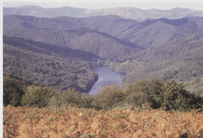
■ Artikutzako barrutiaren ikuspegi zabala Pagolletatik

haranaren ikuspegi ederraz gozatzeko aukera izango dugu. Ikusmenari gozatua eman ostean, hesiaren ondotik doan zidorra segituko dugu eta berehala iritsiko gara basora. Amekorrungo atakan ondoan berriro Artikutzako barrutian murgilduko gara eta pagadian aurkituko dugun orbela zapalduz erraz jaitsiko gara Pagolletara.