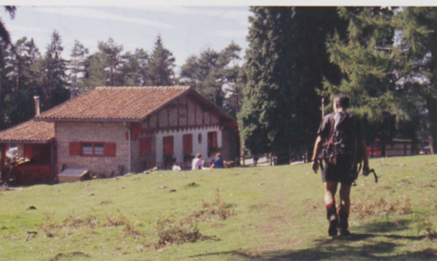
■ Eskaseko atezaindegira iristen

Artikutzako atezaindegiaren ezkerretik atera, langa igaro eta berehala basoan murgilduko gara "napar bidea" izenez ezagutzen den bidea segituz. Bide honen lehen zatian PR NA 125aren marka zuri horiak izango ditugu bidelagun. Batzutan, enbor luze eta leuna duten zuhaitz gazteak ikusiko ditugu, bestetan, berriz, adar erori eta zimurrez beteriko zuhaitz zaharrak. Bakoitzak bere lekua okupatzen baitu espazio erakargarri honetan. Hotsak ez dira falta ere, txorien kantak ezezik, errekaetoen urek orbel eta harrien gainetik igarotzean inguruari jartzen diote musika. Pinu, pago eta izeien artean zabaltzen den bidea oso eroso da eta Burnaiztieta lepora jaitsi aurretik Burdin Aroko mairubaratza bat (harrespila) ikusi ahal izango dugu.