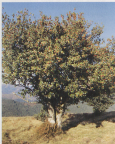
■ Gorosti bikaina Pagolleta inguruan

Bost minutu eskas beharko ditugu alanbrezko hesiaren beste aldean dagoen Izuko gailurra zapaltzeko. Parez pare Mendaurko tontor bikaina eta honen ondoan Mendieder. Arantza herriaren eta Arrata errekek zeharkatzen duen