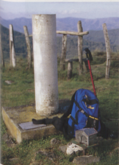
■ Izuko tontorra, Artikutzako barrutiarekin mugan

Langa igaro eta aldapa malkartsu bati aurre egingo diogu eta lehen izerditan kopetatik isurtzen hasi orduko pistara helduko gara. Ezkerrera hartuz gero, berriro urtegioko pistara jaitsiko ginatke, beraz gorantz joko dugu. Aldapa pikoak ez du etenik. Pagadi eta pinu gorrien basora iristean bidea zertxobait leundu egiten da eta tarteka txondor plaza batzuk ere ikusiko ditugu. Gorago, landaretzak ezkatututako eraikin megalitiko batzuk atzean utzi eta bidegurutze batera iritsiko gara. Ezkerreantz joz gero, pagadi bikain bat zeharkatuz Pagolletara jaitsiko ginatke, eskuinera, berriz, Barazar aldera. Guk aurrean dugun bidezidorrari eutsiko diogu eta tontorrera, Izu aldera abiatuko gara azken maldari ekinaz.