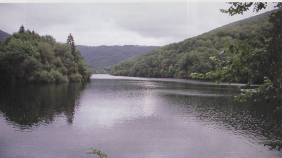
■ Enobietako urtegiaren ikuspegi zabala