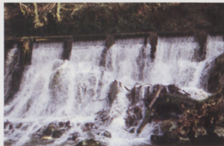
■ Ubideak gainezka egin du eta erreka urak isurtzen ditu

ateratzen den bide zaharra hartuko dugu baserriari bizkarra emanez. Berehala murgilduko gara basoan eta gaztainondo zaharren artean pixkanaka altuera hartzen hasiko gara. Antzinako bide hau tarte batzuetan desagertu egin da higaduraren ondorioz, baina berehala ohartuko gara ubide zaharraren presentzia eta horrek lagunduko digu bidezidor zuzena aukeratzeko.