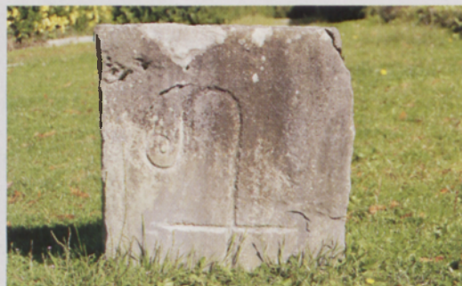
■ Orreagako mugarria

XIII. mendera arte ez ditugu lehenengo erreferentzi historiko idatziak aurkituko eta horietan, antzina lurralde hauek Orreagako Errege Etxe eta bere Ospitale Orokorren menpe egon zirela aipatzen da. Egun, barrutiaren hainbat lekutan Monasterio ospetsuaren irudia den makulua landurik duten zenbait mugarri ikus ditzakegu. Ehun mugarritik gora mantentzen dira oraindik. XIX. mendean Mendizabal eta Esparteroaren Desamortizazio legearen arabera lurralde hauek besterenduak izan ziren eta ondorioz, hurrengo urteetan jabez maiz aldatu ere. Beraz, esan daiteke, XIII. mendetik XIX. mendera arte barruti osoa Orreagako Santa Maria Kolejiata Errealaren eskutan egon zela eta garai horietan eman zela Artikutzako balore naturalen ustiatetarik handiena, mende horietan sortu baitziren burdinaren metalurgia gunerik garrantzitsuenak. Ikazkinek, artzainek, karobigileek eta burdingintzan aritzen zirenek jabeen errenta ordaintzen zieten lur horien ustiatetaren truke.