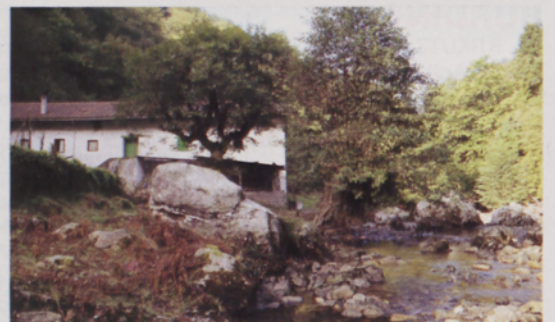
■ Berdabio baserria eta Añarbe erreka

Berdabiyo'ren xaldiyak Lau anak ditu txuriyak Salto batian irago zuen Zazpi estatuko esiya; Beste bat igaro balu, Seguru zuen biziya.