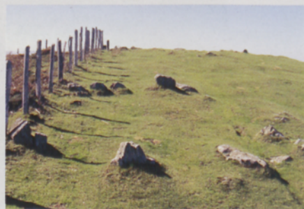
■ Irumugarrietako mairubaratzak

O IARTZUNGO mendietan eta Nafarroako inguruko herrietan harrespil mordoak aurki dezakegu. Oiartzunen "Mairubaratzak" izenez ezagutzen dituzte. "Mairu" hitza euskal mitologiarekin lotuta dago, izen honekin kristauak ez diren pertsonak izendatzen dira, bataiatu gabeak. Normalean monumentu megalitiko hauek mendilepo edo muinoetan kokaturik daude, batik bat artzaintza oso zabaldua zen ingurutan. Esan behar da Bianditz-Oianleku inguruko parajeak artaldean joan-etorrien lekuko izan direla mendeetan zehar. Azpimarratzekoa da ere, Burdin Aroan Euskal Herriko ekialdeko direnekin harrespilak eta tumuluak eraiki zituztela, errausketa egin ostean, gorpuzkinak ehortzeko eta mendebaldekoek berriz trikuharriak. Artikutzako lurretan ugariagoak dira harrespilak, 60tik gora baitaude, baina hauek haranen sakonean baino barrutiaren zonalde altuetan daude. Trikuharriak, berriz, hiru bakarrik aurkituko ditugu.