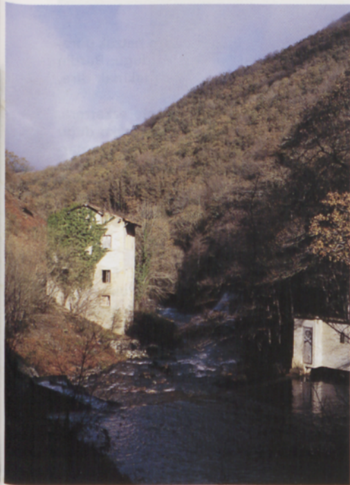
■ Añarbe erreka eta Presaetxe

parera. Leku honetan alanbrezko hesia gainditu eta xenda txiki bat bilatuko dugu erreka ondora jaisteko. Zubi zaharra igaro eta erreka beste aldean izango gara. Leku isila, naturaren babesa bilatzen duena ezkutuan gordetzeko aproposa. Misteriozkoa. Zubiaren ondok, ezkerrean