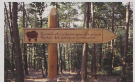
■ Burnibide zaharraren arrastoak erakusten duen bide-seinalea

E GUN ingurune babestua bada ere, historian zehar Artikutzako lurak bizimodu desberdinen eta bertako errekurtso naturalen ustiapen ugarien lekuko izan direla esan behar da. Europan gertatu ziren aurrerapen teknologikoen ondorioz, burdinolak baztertu egin ziren, erabat ahaztu arte. Hauek izan ziren garai zailenak. Momentuko korrante sozio-ekonomikoen babesean, egur-ikatzaren ekoizpena eta meategien ustiapena (burdina batik batik) indartu eta areagotu egin ziren. Horrela, 1898an bide estuko trenna eraiki zen ustiapen horiek errazteko. 1903tik 1908ra Artikutzako Oihandar eta Ustiapenerako Konpainiak eratu ziren. Burdinbidearen bihotza Elamako meategi gunea zen eta hau Errenteriako iparraldeko geltokiarekin komunikatzera iritsi zen, plano inklinatu eta korapilotsu baten bitartez. Neurririk gabeko ustiapen hauek basoaren berehalako atzerakada ekarri zuten 1919an Donostiako udalak finka erosi eta berreskurapen lanak hasi arte.