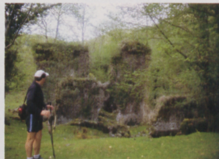
■ Goizaringo burdinolaren aurriak

Industria metalurgikoarekin guztiz loturik zegoen ikazkintza izan da paisaia eraldatu duen beste jardueretako bat eta horren lekuko pagadietan aurki daitezkeen "txondor-plaza" (txondorrek eraikitzeko plataformak) ugariak. Ekonomia guztia egurraren inguruan oinarrituta zegoenez, jarduera industrial honek eragin nabarmen izan zuen Artikutzako basoetan. Gaur egun, paraje hauek isiltasunean murgildurik daude, eta naturak galdutako espazioa berreskuratu du.