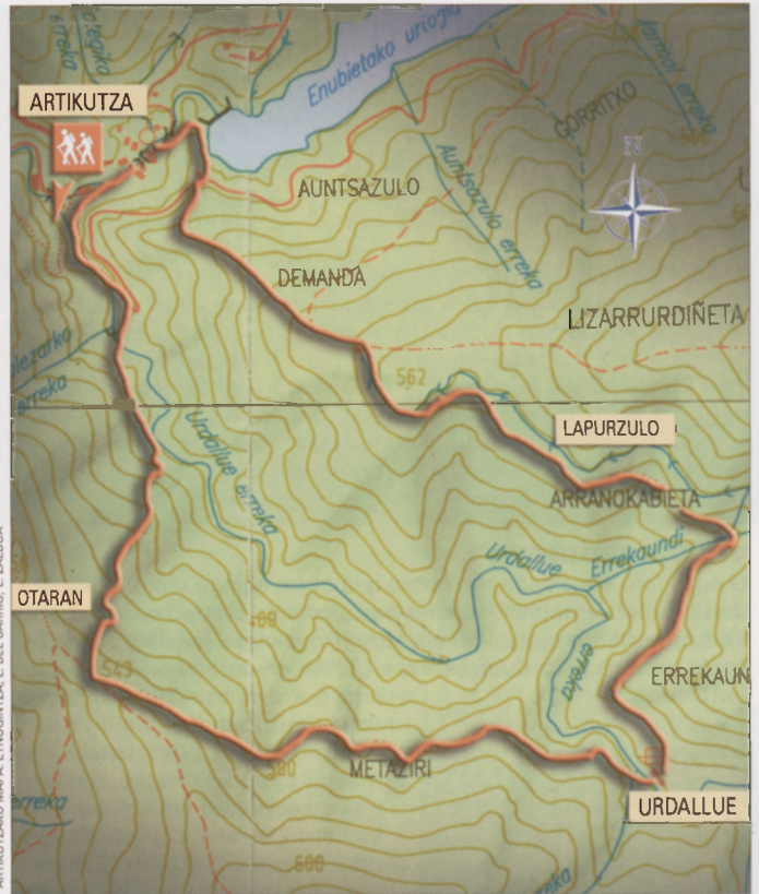
ARTIKUTZAKO MAPA. ETNOGINTZA, L. DEL BARRIO, L. ZALDUA

Pagadia zeharkatzen duen bidezidorra segituz, laster sakanaren hondora helduko gara. Enborrez eraturako zubitxo bat zeharkatuko dugu beste aldera pasatzeko. Urdallueko burdinola eta baserri-multzo zaharraren aztarnek aurrez aurre egingo dugu topo. Denboraren poderioz, natura pixkanaka eraikin hauek guztiak estaliz joan da eta egun zail samarra gertatzen da eraikin horien egitura osoa nabarmentzea.