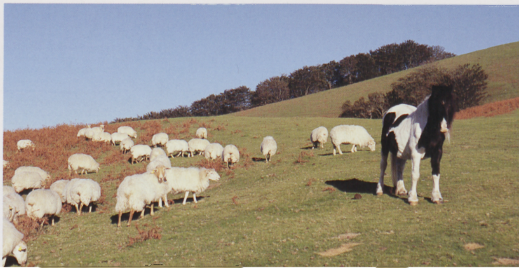
■ Pottokak eta ardiak Bianditzeko lepotik gertu