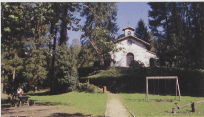
■ Artikutza herrian, San Agustin ermita

Almandoz etxea inguratzen duen pistan zehar, laster San Agustin kaperaren ondotik pasako gara eta ibilbidean aurkituko dugun aldapa bakarrari aurre egingo diogu. Lehenengo txaleta eskuinera utzi eta aldapa amaiztean, ezkerrera doan pista jarraitu behar da, eskuinekoa aterpetxera baitoa. Ibilgailuen pasoa eragozten duen langa metalikoa pasa eta pista zabala bezain eroso jarraituz urtegia inguratzen hasiko gara. Ibilbide osoa balizaturik dago eta bide seinale zuri-berdeak izango ditugu bidelagun (SLNA 121).