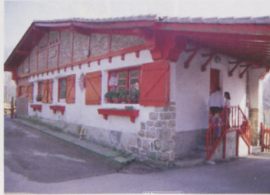
■ Eskaseko atezaindegia

Guardaren etxetik abiatu eta 400 metro inguru beteko ditugu errepidetik PR NA-124ari dagozkion bide-seinale zuri-horiak jarraituz. Errepidea utzi eta pagadian murgilduko gara. Bidea zabala da eta jaitiera piko batek, Eskaspe erreka igarotzeko egur enborrez egindako zubitxora eramango gaitu. Bidea leundu egiten da eta isiltasuna nagusituko da goroldioz jantzi-tako pago zaharren erreinu honetan.