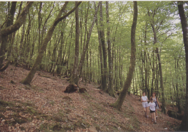
■ Urdallueko sakan aldera jaisten

Enbor luzeko pago gazte askok osaturiko pagadi ikusgarri bezain eder honetan murgildurik, orbelak lurra erabat estaltzen du eta tarteka bidea ikusgaitza da. Pagaditik ateratzean, Goizarindik Beltzuntzera doan pista batekin egingo dugu topo. Metro gutxi batzuk aurrerago, berriz, ezkerreara hartu behar da Urdallueko pagadian barneratzen den beste xenda bat jarraituz. Pago enborrean marka gorri bat ikusiko dugu.