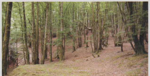
■ Otarango pagadi bikainean aurkituko dugun txondor plaza bat

Pagadiko hezetasunak zenbait anfibioentzat bizi-baldintza egokiak eskaintzen ditu eta narrastientzat leku aproposenak ez badira ere, gutxi batzuk aurkituko ditugu. Hegazi espezieak urriak dira pagadietan eta ugatzunak ere badira inguru hauetan.