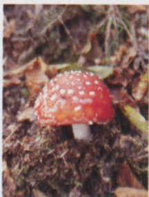
■ Amanita muscaria