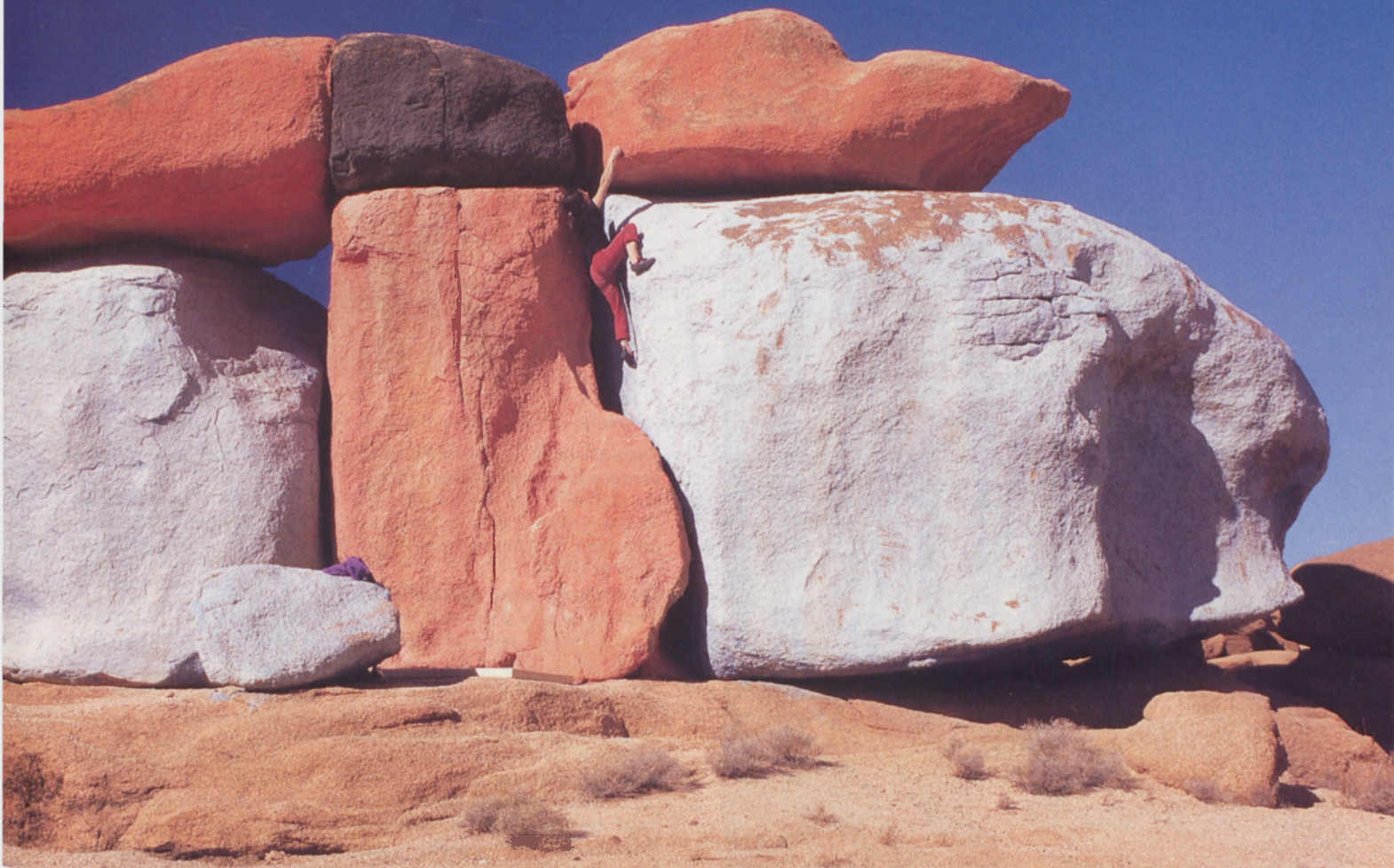
■ Tafraoute, Maroko 2000

bai, baina esan bezala ez nau hainbeste betetzen. Beste ate batzuk ere ireki nahi ditut, beste jakinmin batzuk asetu.