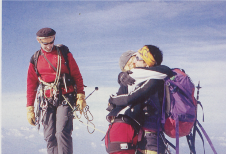
■ Gailurraren poza

Aurten Mont Blanc izan da bilgunea. Eta datorren urtean? Oraingoan, datorren urtekoa gorderik dago, eskailerapean, ardo ona bezala. □