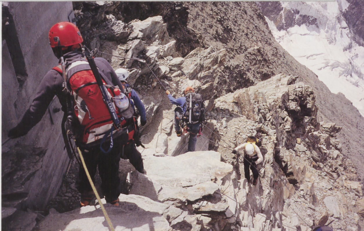
■ Lagginhorn, gora-behera ugari