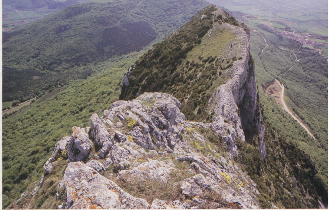
■ Cresterío de Peñalla en la sierra Toloño