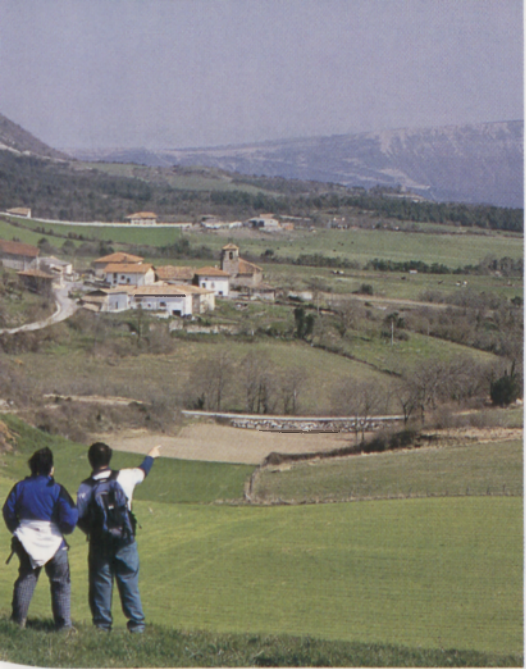
■ Valle de Kuartango y monte Marinda