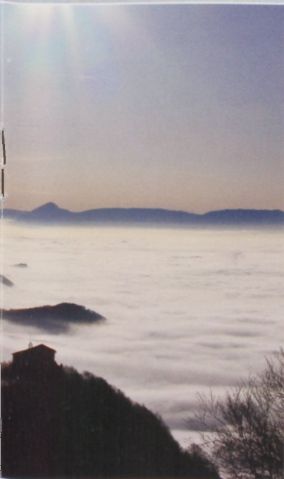
nitate basiliza lagun. Iruñerriko itzean