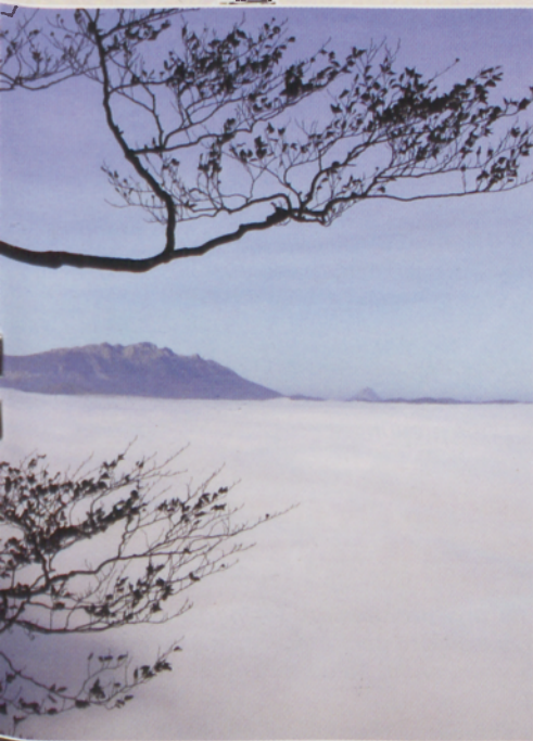
a hor Aratz, Aizkorri eta Udalatz