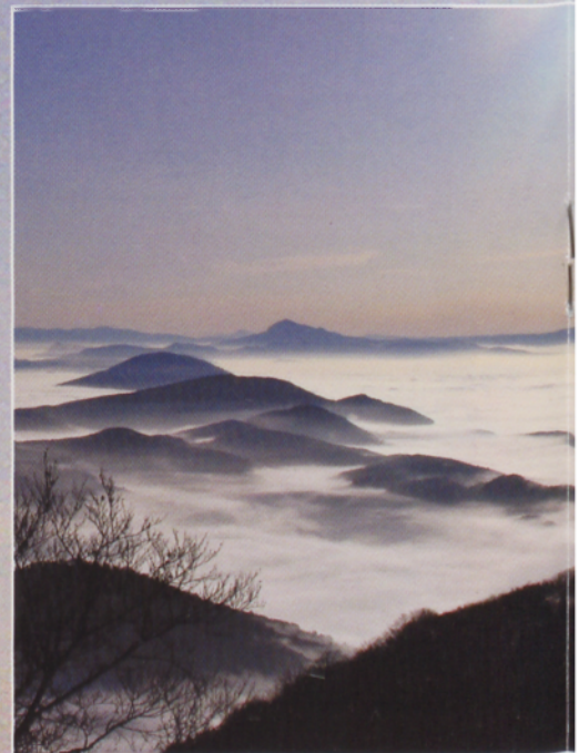
● Sakanan, ekialdeko muturrean dago Erga, Irre balkoi paragabea. Itzaga, Elomendi eta Alaitz cit