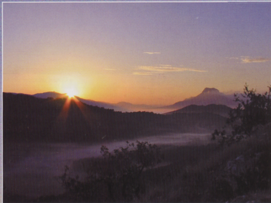
● Aralarko San Migeletik bertatik eguna argitzen Urdiaingo Sarabetik ikusita. San Donato lekuko eta urrutian Erga; bagoaz harantz...