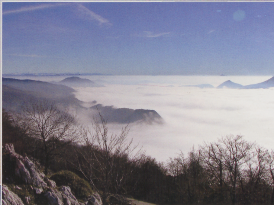
● San Migelerako bidean, sortaldera begiratuz: Pirinioak, Erga eta Madalenaitz, Gaztelu eta Txurregi eskuinean