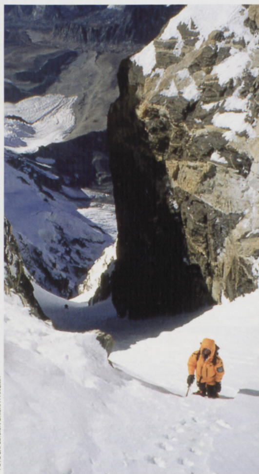
FOTO EXPEDICIÓN SHISHA PANGMA