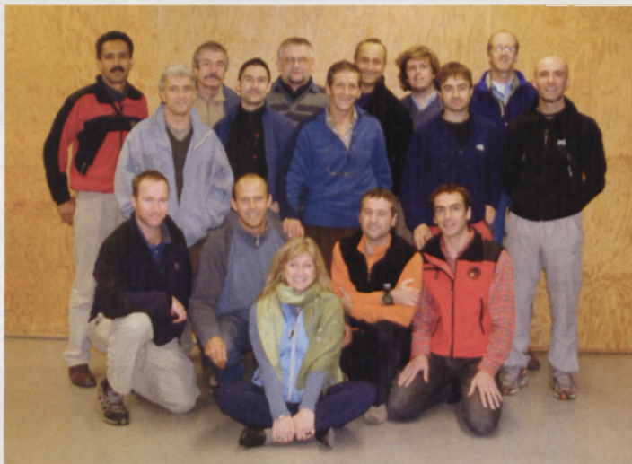
■ "La Comisión trabajando en Eginu" y la "Foto de familia"