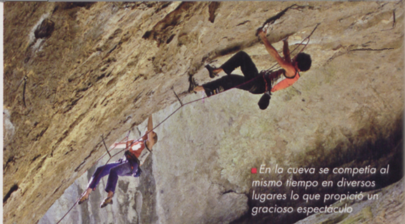
En la cueva se competía al mismo tiempo en diversos lugares lo que propició un gracioso espectáculo

Entre el 20 y el 24 de septiembre se celebró en la localidad vizcaína de Dima la primera edición de un Rockmaster que reunió a lo más granado de la escalada mundial bajo los desplomes de la cueva de Baltzola y en plena plaza municipal. Competiciones, exhibiciones y participación popular posibilitaron que el deporte vertical tomara por unos días este bello rincón natural del valle de Arratia.