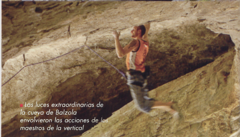
Las luces extraordinarias de la cueva de Baltzola envolvieron las acciones de los maestros de la vertical

Nunca antes se había reunido en una sola jornada tanta juventud en Dima. El acontecimiento lo merecía y ofreció a cambio emociones y espectáculo durante cuatro días consecutivos con la escalada en el eje de cada conversación.