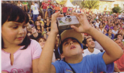
■ La expectación estuvo a la altura del espectáculo constante en la plaza de Dima

La maestría y elegancia de los escaladores quedó iluminada por las magníficas luces de la cueva que proporcionó el mejor de los escenarios para un espectáculo visual. Toda una jornada para terminar con un singular duelo entre vascos y austriacos, con la disputa por encadenar una nueva vía en los cinco últimos minutos. Sin duda el conocimiento elevado desde primeras horas de la mañana. El Campeonato de Euskadi ponía sobre los muros de un espectacular rocódromo instalado en la plaza de Dima, también plaza de toros en otros tiempos, a toda una sucesión de escaladores vascos aspirando a un título.