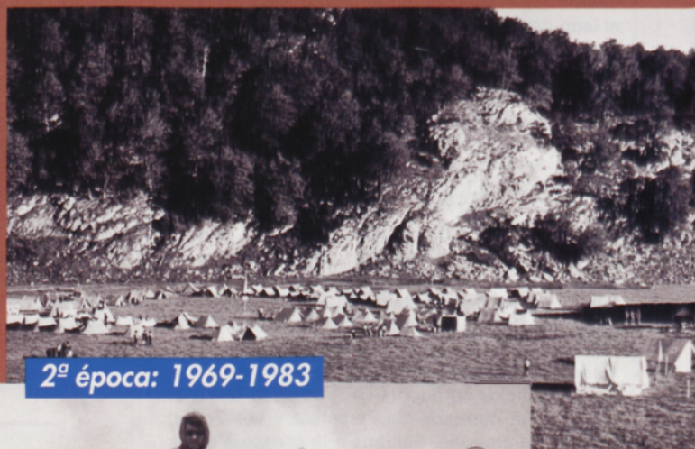
2ª época: 1969-1983

• Grupo de excursionistas de Erlaitz M.E. frente al refugio Vishente en Amezketz montaña. 13 de abril de 1958