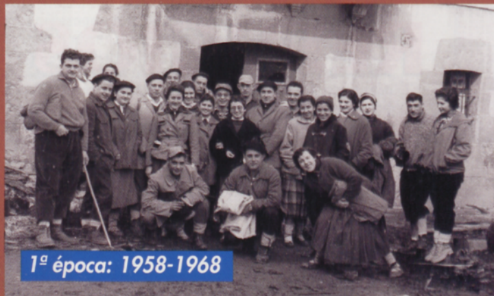
1ª época: 1958-1968

Dentro del concurso de los "Cien Montes" y hasta este año, se cuenta con el ingreso en la Hermandad de Centenarios Alpinos, representando a "ERLAITZ" Mendi Elkartea,