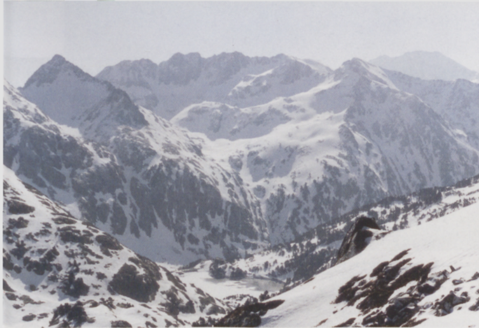
■ Ezkerretik hasita: piramide itxurako Punta del Port tontor tentea eta Broateko gailurrak Salibarriko zirkua osatuz. Behean Estany Romedo de Baix laku

beraz. Aurreko egunean igotako pendiz izoztuetan behera kontu pixka batez jaitsi ginen Clot de l'Escalara. Hortik behera jaitsiera lasaia goa egin genuen 1920 metro tara iritsi arte.