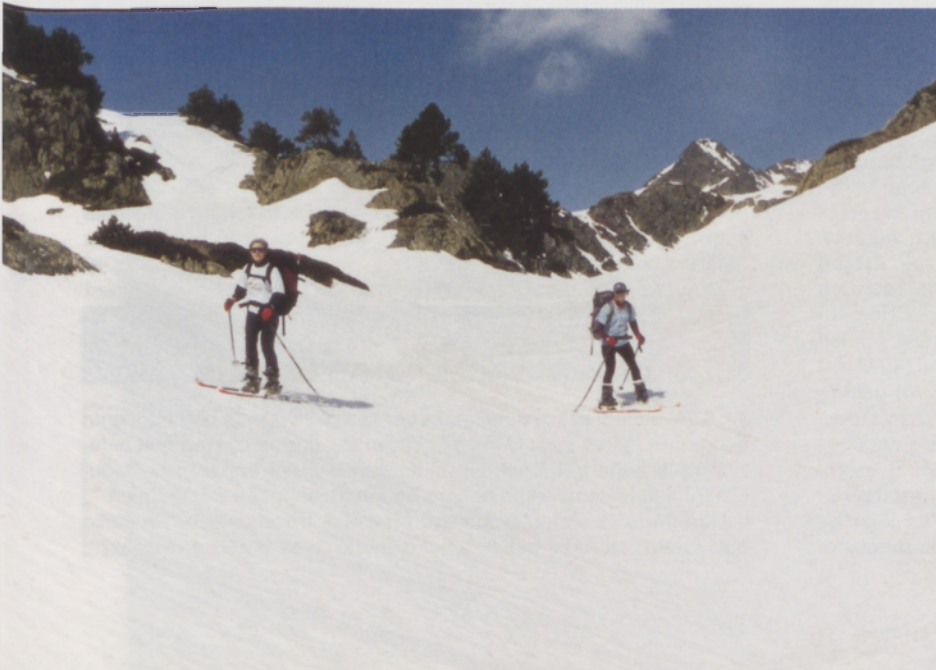
■ Estany Romedo de Dalt lakutik behera haranean barrena goxo-goxo eskiatzen

aurrera geratzen zitzaiguna estaliz. Egoera ez zen batere samurra: eguraldi petrala eta behelainoaz gain, ia 2600 metro tan dagoen Certascango lepoa falta zitzaigun oraindik. Bi aukera genituen: mapetan amestutako zeharkaldia bertan behera uztea (alegia, Noarretik Tavascanera joatea zen lehenengo aukera, han baitzegoen kotxea) ala kosta ahala kosta aurrera segitzea. Egoera hura ahalik eta modu arrazoituenean hausnartu ondoren, zenbait zalantza izanagatik ere, aurrera jarraitzea erabaki genuen. Bene-benetan diotsuet uztekotan egon ginela.