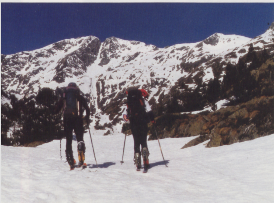
■ Zeru oskarbi, Mont Roig aldera gindoazela, parez pare geneukan bi gailur bikien arteko harratera igotzen den couloirra edo kanala

D UDA-mudazko eguraldia hobetuko zen esperantzatan, geure irteera atzeratzea erabaki genuen. Azkenean, 10:30etan atera ginen Enric Pujol aterpe ttiki atseginetik, hala ere. Oso berandu,