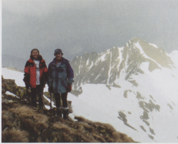
■ Cap de Broateko gailurrean. Atzean eskubian "Passage du Bang" delako ataka bikoitza

Lehendabizi ezkerreko atakatik jaisten den kanalarri bota genion bistadizoa: "De diooo! Hemendik jo behar al diagu?" Iparrerialdera begira dagoen kanal estu, ospel eta iluna da, ikaragarri pikoa gainera. "Ea bada, ikus dezagun beste atakatik beherakoa. Ene! Hau okerrago zagok eta". Atzera ere, ezkerrekoari bigarren bistadizoa eman genion. Hirugarren egun honetan ere berandutzen ari zitzaigun eta gainera, ustekabe hau. Zer egin erabakitze