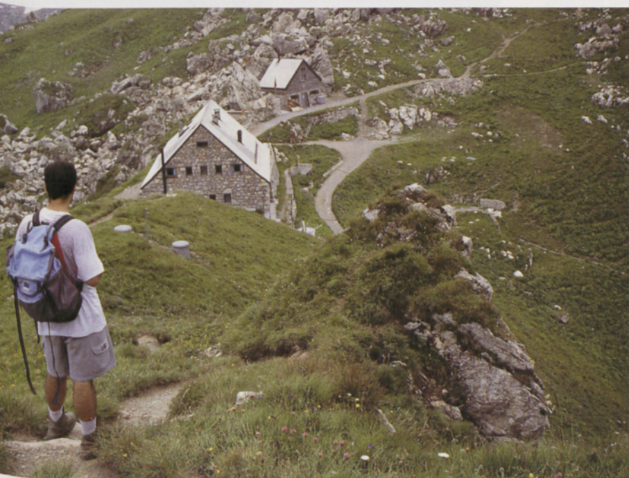
■ Refugio Plälzer hütte (2108 m)