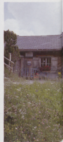
■ Por el cordal, camino del Kuhgrat (2123 m)