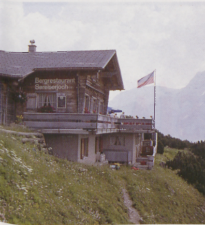
■ Refugio Sareiserjoch (2000 m)

evitar en lo posible la aérea cresta entre las dos cotas del Grauspitz, se gana su collado ladeando a través del valle colgante Schafälpi. La roca desde el collado al Vorder Grauspitz (3 h) permite una trepada más asequible que el tramo evitado desde el Hinter. □