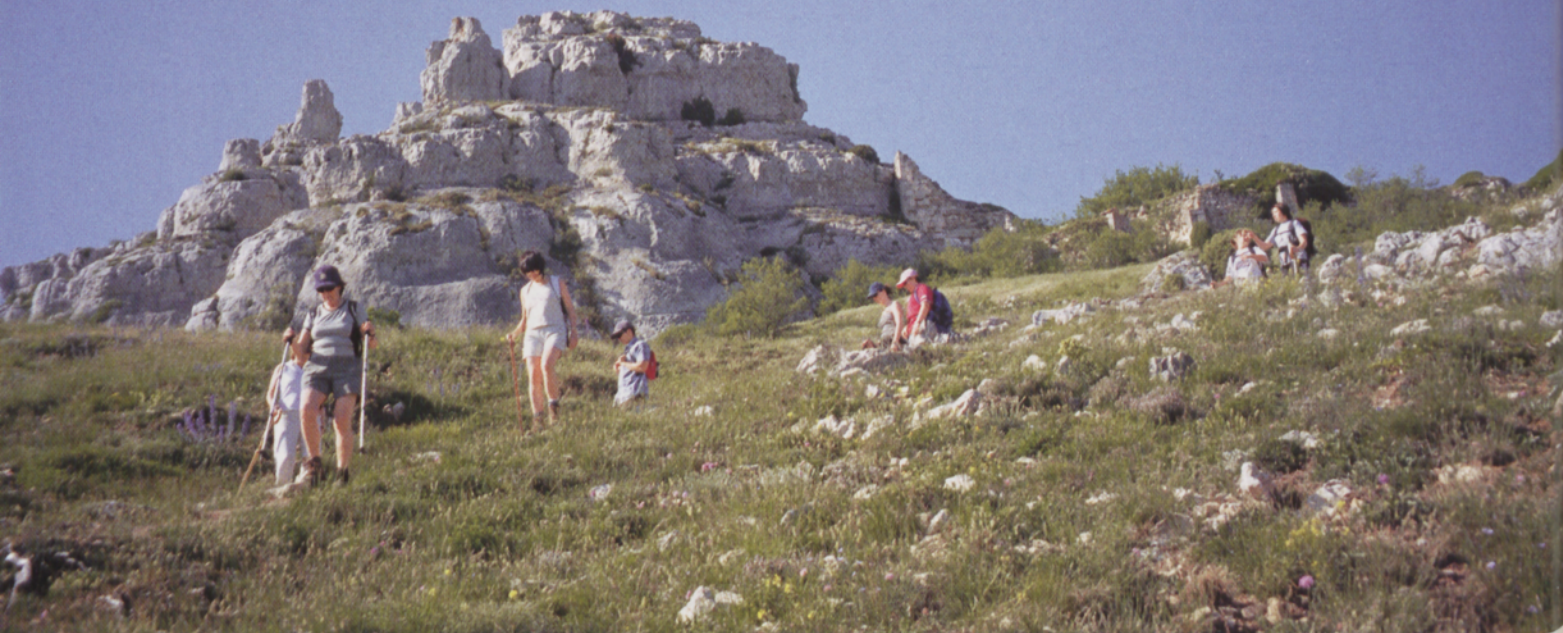
■ Dejando atrás las ruinas del santuario y las neveras, a los pies del castillo

peñas pasamos una valla, otro pequeño collado y subimos a la cota más alta de la Peña del León (1215 m, 2,00 h ), también con buzón, que marca 1224 m.