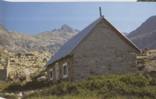
■ Refugio grande del Ibón Inferior de Bachimaña