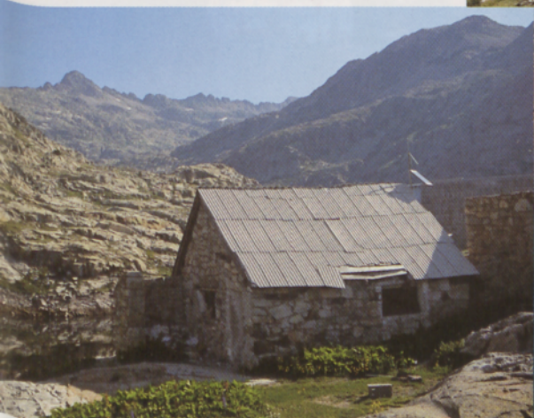
■ Refugio pequeño del Ibón Inferior de Bachimaña