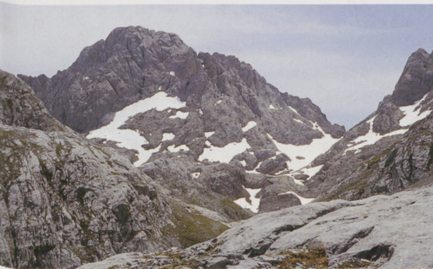
Peñasanta de Castilla

Inicio el descenso por el mismo itinerario hasta la Horcada de Caín. La ruta hasta Horcados Rojos es un sube-baja continuo; con el recorrido acumulado resulta bastante pesado para mis piernas. Ahora el camino es muy bueno, luego enlaza con la pista de la Vueltona a las campas de Aliva. Al dejar la pista en la Llomba del Toro (1420 m) sigo un flanqueo ascendente hasta dar con el Canalón del Jierro. Según el mapa el itinerario de subida a la Morra pasa por el Collado Valdominguero, pero yo decido remontar todo el canalón por terreno rocoso y pedreras, sin apenas rastro de sendero, pero con algún que otro cairn, para acceder por la Horcada del Jierro. Según voy subiendo me asaltan las dudas de si mi elección habrá sido la acer-