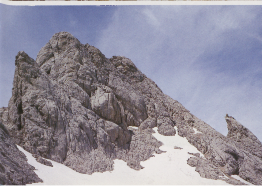
Torre de Cerredo