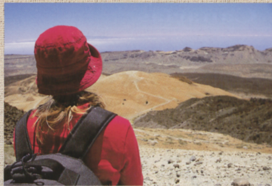
■ Las vistas de Montaña Rajada y las cañadas acompañan en la ascensión

■ La imponente sombra del Teide patrulla sus dominios en cada atardecer