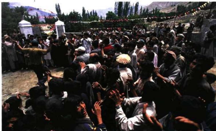
■ Machulun eskola eta Ureztatze sistemaren inaugurazio festa