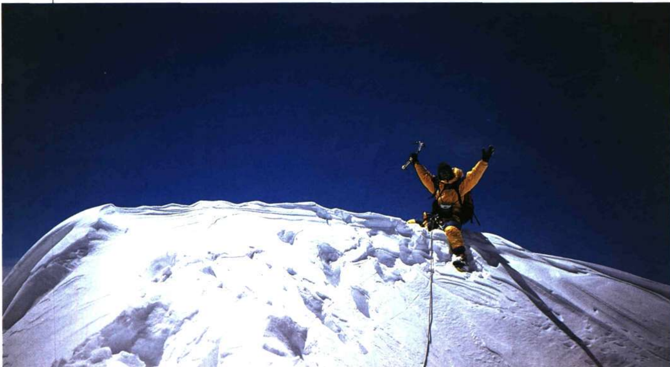
■ Beloki G-IIIko gailurrean

Geroztik, umezurtz jarraitzen du G-IIIk. □