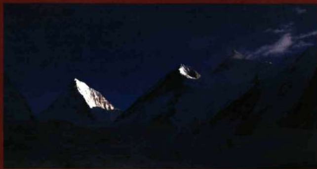
■ Gasherbrum IV, III, II

Cima: 26 de julio, sobre las 10:30 de la mañana.