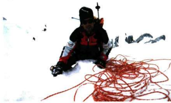
■ G-Ilko bidean bigarren kanpora bidean Banana izeneko tartean

Aspaldidanik da Gasherbrum IVa alpinista aurreratuenen gustoko mokadua. K-2ra joan ziren aurreneko espedizioak itsututa geratu bide ziren G-IVko mendebaldeko horma puska ikusita. Itsututa. Ez zioten alferrik jarri "The Shining Wall" izena, horma distiratsua. Haren ertzei erreparatuta, ezinezkotzat jo zuten hasiera hartan. 1954an K-2 menderatu zuen espedizio italiarreko kideen artean, ordea, alpinistetako batek beste begi batzuekin begiratu zion G-IVari. Hura ere itsutu egin zen, baina