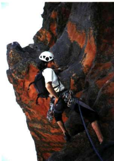
■ Moonariko: "Sweeping Pterodactyls", 22 (6b+ / 6c)

Blue Mountains aldean hiru egunetatik bitan euria ari duela diote, eta gu horren lekuko ezin hobeak izan ginen. Euri jasek