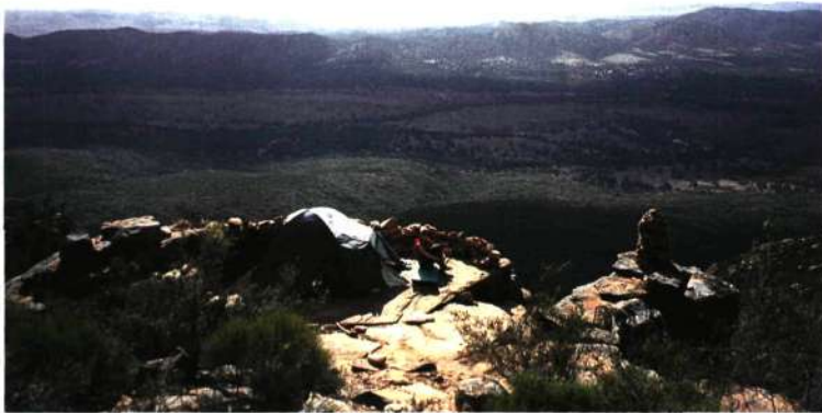
■ Vivac de lujo sobre el Outback australiano en Moonarie