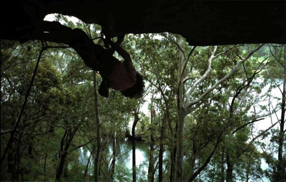
■ Escalada deportiva en Nowra. "Cowboy Junkies", 25 (7b)

eta ondasunak eramaten dituztenak, kilometro luzeetan zehar errepidearen biztanle bakarrak izanik.