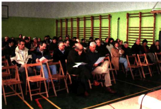
■ Dos aspectos de la Asamblea