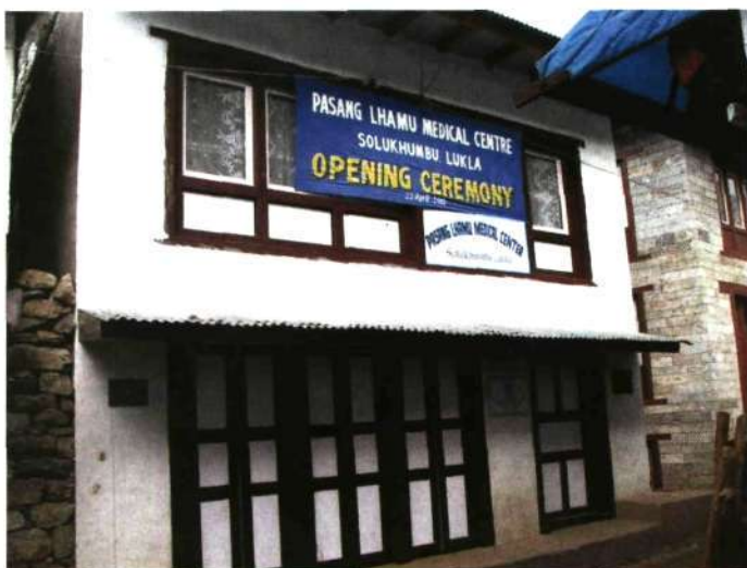
■ El Centro Medico situado en Lukla

ha contado para su financiación con el patrocinio de unas cuantas empresas y las administraciones locales alavesas y el Departamento de Sanidad del Gobierno Vasco.