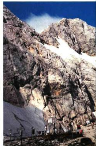
Triglav. Gailurrera iristen, jende pilarekin batera

■ Prag bidetik Triglavski Dom-era igotzen. Prag bide normala da, jende gehienak erabiltzen duena, baina hego isurialdetik bada beste bide errazago bat (Planika aterpetik)