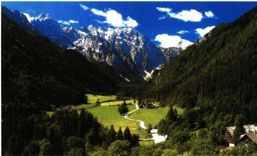
▲ Logarska Dolinako arana

1872an ezarri zen trenbidea, eta 1884ean argi elektrikoa. Bisitari berezientzat, gainera, 16.000 kandela eta ehudaka farola pizten ziren. Geroago, iluminazio elektrikoa modernizatu da, bonbila halogenoak jarri... Lurpeko espazio zabalek mistikotasun pixka bat galdu zuten honela. Dena dago bistara, azken zokoraino. □