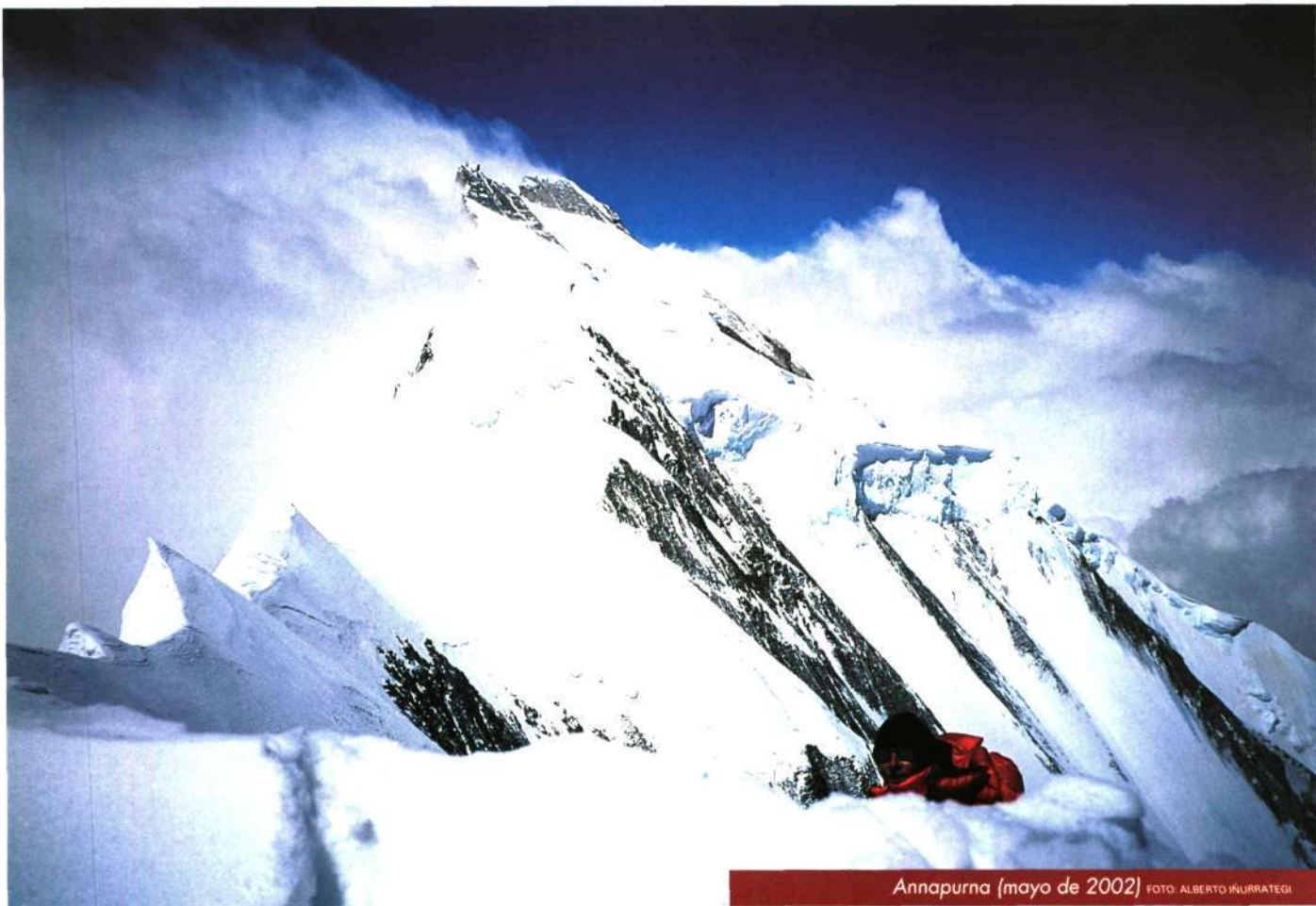
Annapurna (mayo de 2002)

especies de flora y fauna en peligro de extinción cuya supervivencia depende de medidas de protección específicas.