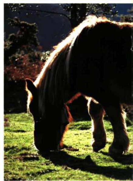
PASTANDO. Cercanías de Akaitza