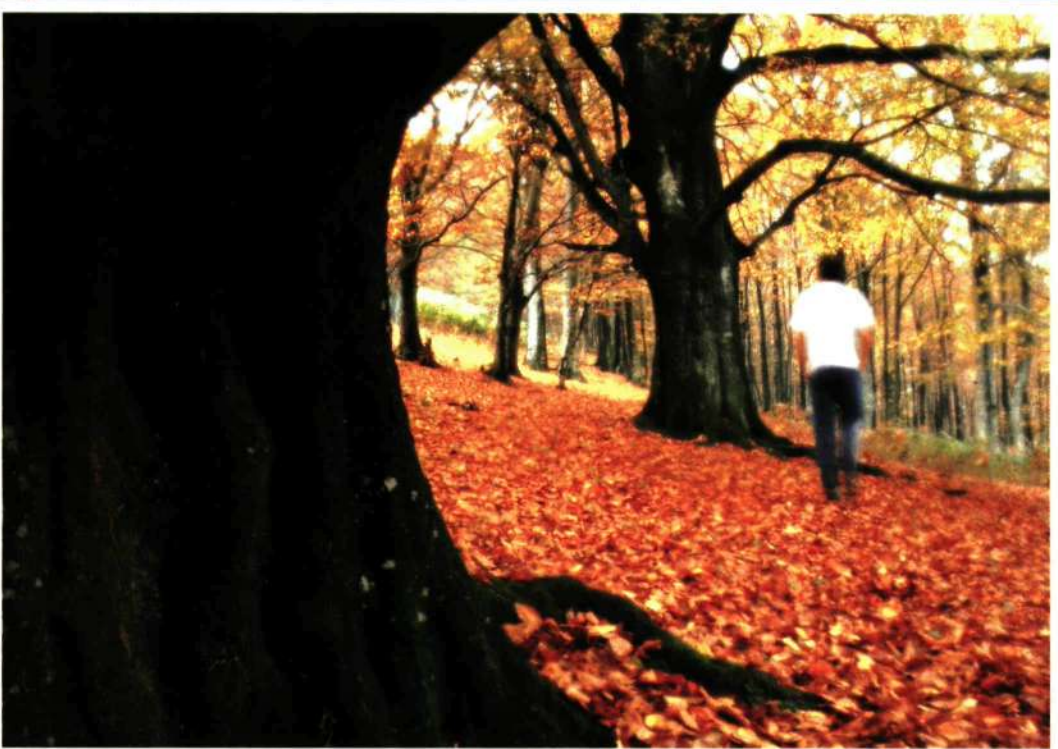
UN PASEO OTOÑAL. Cerca del camino que lleva de Lizarrusti a Igaratza