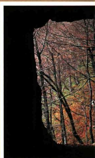
SALIENDO HACIA LA LUZ. camino hacia el lago Lare