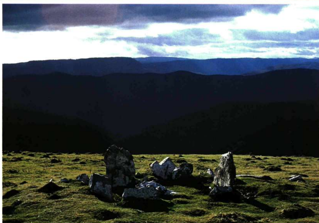
LUZ Y SOMBRA. Cromlech al lado del monte Gaineta