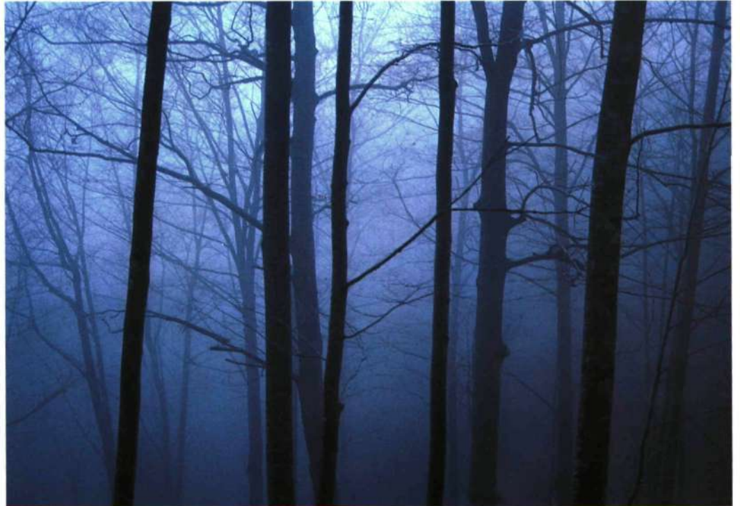
NIEBLA. Cercanías de Miruaitz