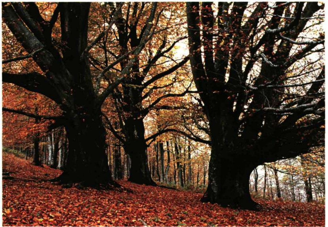
HAYAS. Cerca del camino que lleva de Lizarrusti a Igaratza