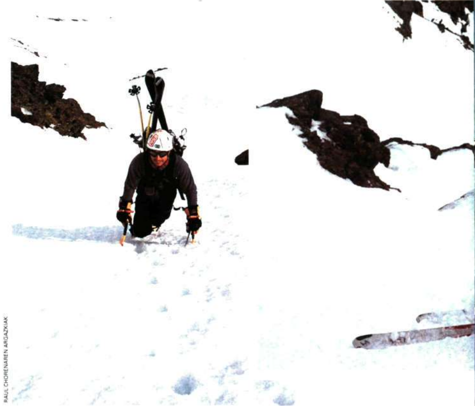
RAUL CHORENAREN ARGAZKIAK