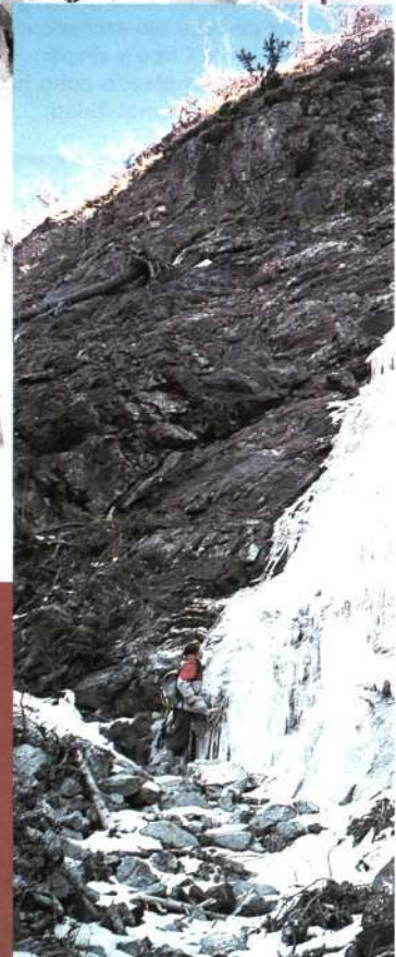
Arriba. En las cortinas de hielo de la cascada de los Cursetistas En el centro. Curiosas formaciones de la "Por allí asoma" A la derecha. Bajo el primer largo de la cascada de las Trabadas Debajo. La divertida Aiguazú