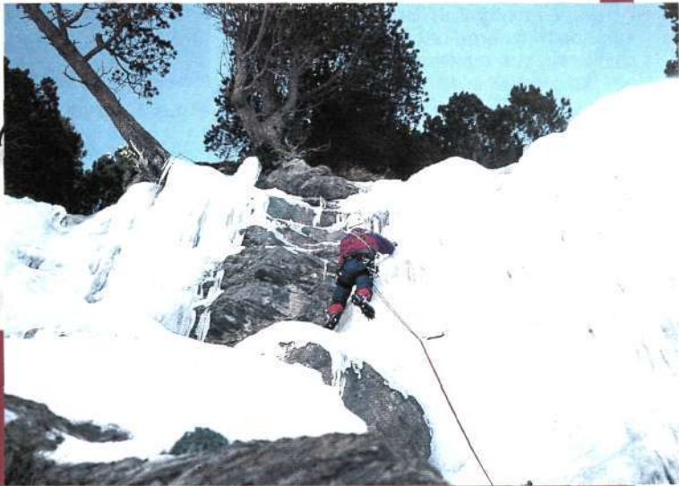
Arriba. Segundo largo de la cascada de Baños A la izquierda. En la "Por allí asoma" A la derecha. La hermosa cascada Ardonés