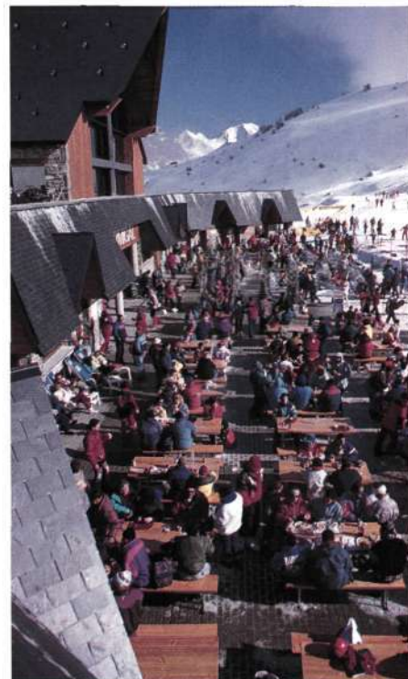
De izquierda a derecha. Estación de esquí de Formigal. Valle de Izas.

situada en el valle alto de acceso inmediato a las estaciones de esquí de Candanchú y Astún.