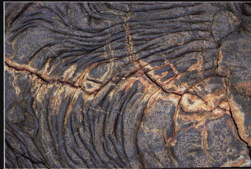
▲ Lugar donde se tomaron. Isla Santiago- Galápagos (Ecuador) ▼