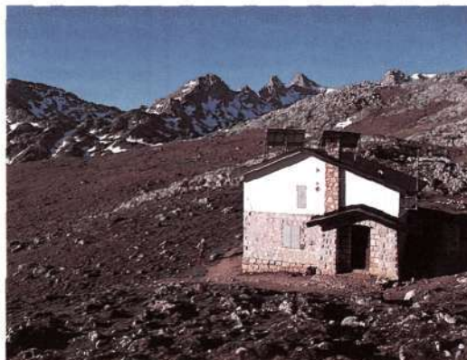
Refugio Pidal en Vega de Ario

La obra adjudicada a F. de C. y C. el 19 de enero, 17 días después, todo un record, se habían iniciado las obras.