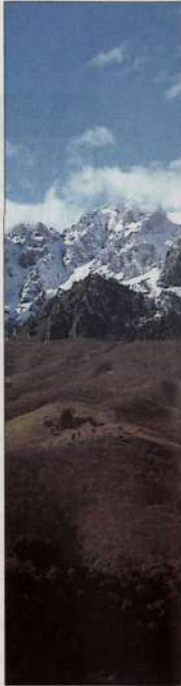
Arriba. Picos. Macizo Oriental