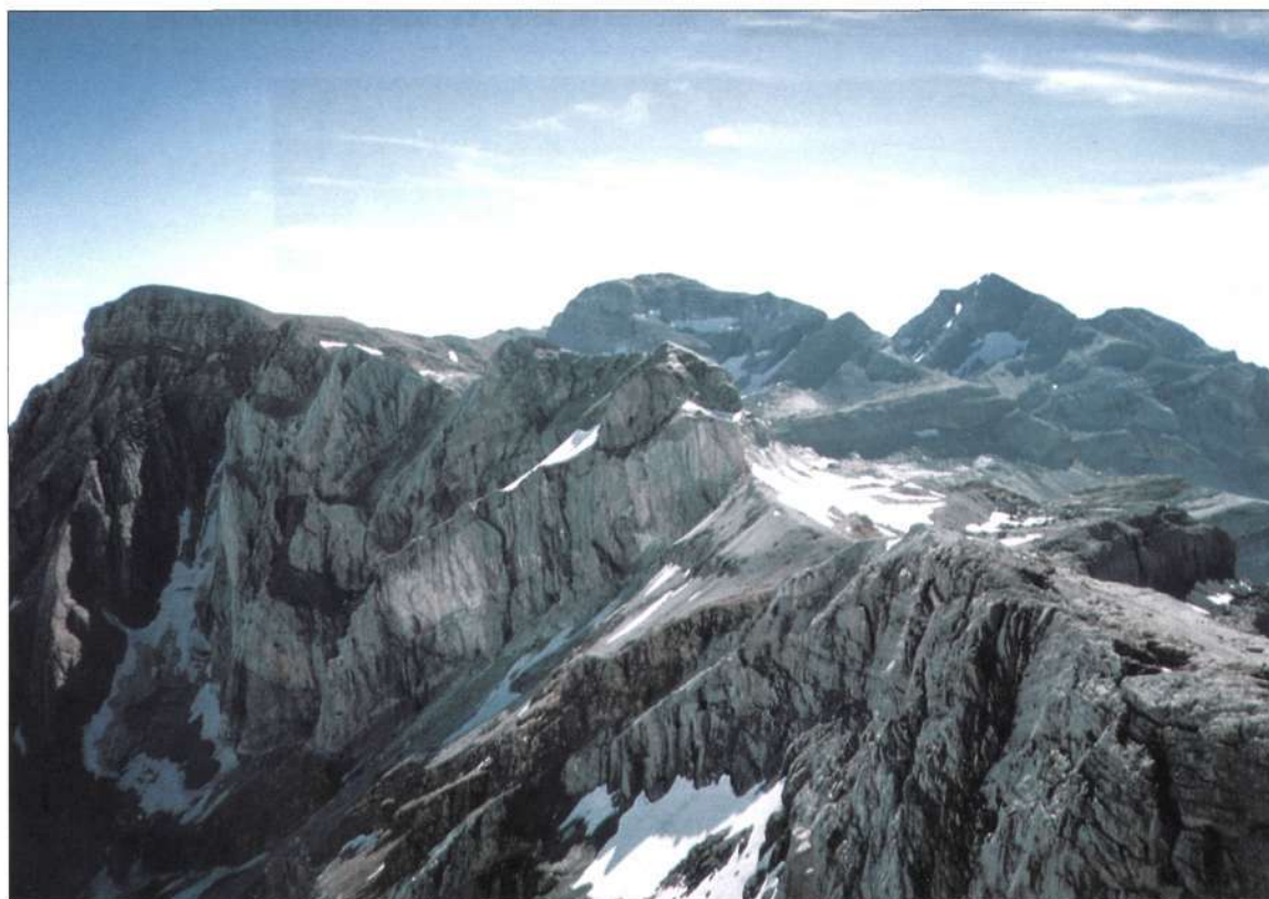
Arriba. Desde el Pico Custodia la panorámica se extiende desde el Taillón hasta el Marboré