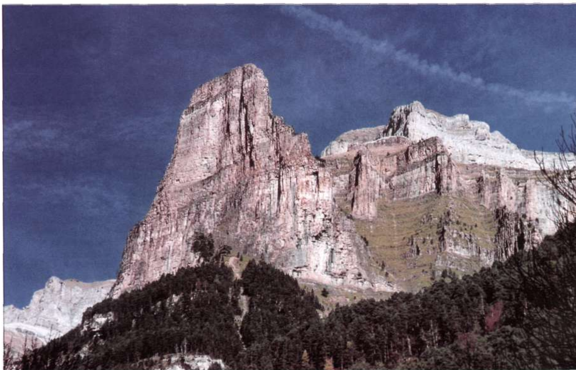
El Tozal del Mallo desde el Valle de Ordesa

Esta noche no estaremos solos ya que en casi todas las terrazas y bajo los extraplomos, hay otros grupos que se preparan para pasar la noche. Bajamos a buscar agua al llano de Millaris, en donde hay gente con tiendas de campaña. Es la época del año más frecuentada y seguramente los refugios de Góriz y Serradets, estarán rebosantes.