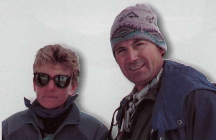
Panorámica en dirección al Valle de Añisclo desde el Collado Superior de Góriz

Han pasado casi treinta años desde que hiciera con dos amigos mi primera travesía enlazando el Taillón con el Soum