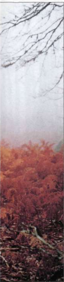
Cruzando los helechales en el primer tramo del recorrido.