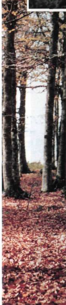
En el bosque de hayas anterior a la cumbre.