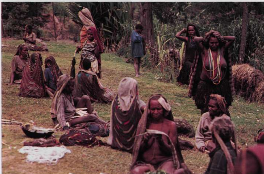
Jendearen apaltasunakin gozatuz

Hegaldia amaiezina izan zen Madrid-Yakarta-Biak-Nabire-Ilaga, lau hegaldi guztira, eta hiru egunen buruan herri honetara heldu nintzen, Dani-ra Irian Jaya barruan; kolonia indonesioa Guinea Papua Berriarekin mugan. Bi egun tramite kontutan ibili ondoren, 20an, 8 porteadorekin irten nintzen K.B-ra, Carstenz-eko hormara, 4.880 metrotara.