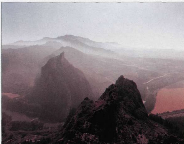
"Las Conchas" de Haro. Peñas de Bilibio