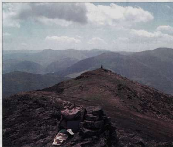
Caste. Picos de Urbión.

En el confín septentrional, La Rioja ribereña limita con los Montes Obarenes, colindantes con Burgos y a su derecha, hacia el E., a partir del río Ebro con la sierra de Toloño, colindante a su vez con Alava.