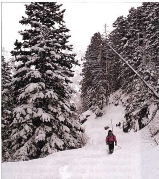
Pista de Areu al pla de Boet (abril 1994)

la ardilla, el lirón, el zorro, la liebre alpina, el gatamontés, el urogallo, el tejón, la marta garñuda y el jabalí o "senglar"; en los ríos, las truchas y sus enemigas las nutrias. Subiendo montaña arriba podemos encontrar manadas de rebecos o "isards" y entre ellos podemos identificar algún muflón de los que han sido introducidos desde la vertiente francesa; en los roquedos y antiguas morrenas vive la marmota, que también ha gozado de un programa de introducción francés, y por las altas cumbres podemos encontrar la perdiz nival. Pero si levantamos la cabeza quedaremos realmente sorprendidos al apreciar el vuelo de las grandes rapaces, como el águila real, el buitre común, el alimoche, el halcón, el milano negro, e incluso algún quebrantahuesos, especie muy escasa y protegida.