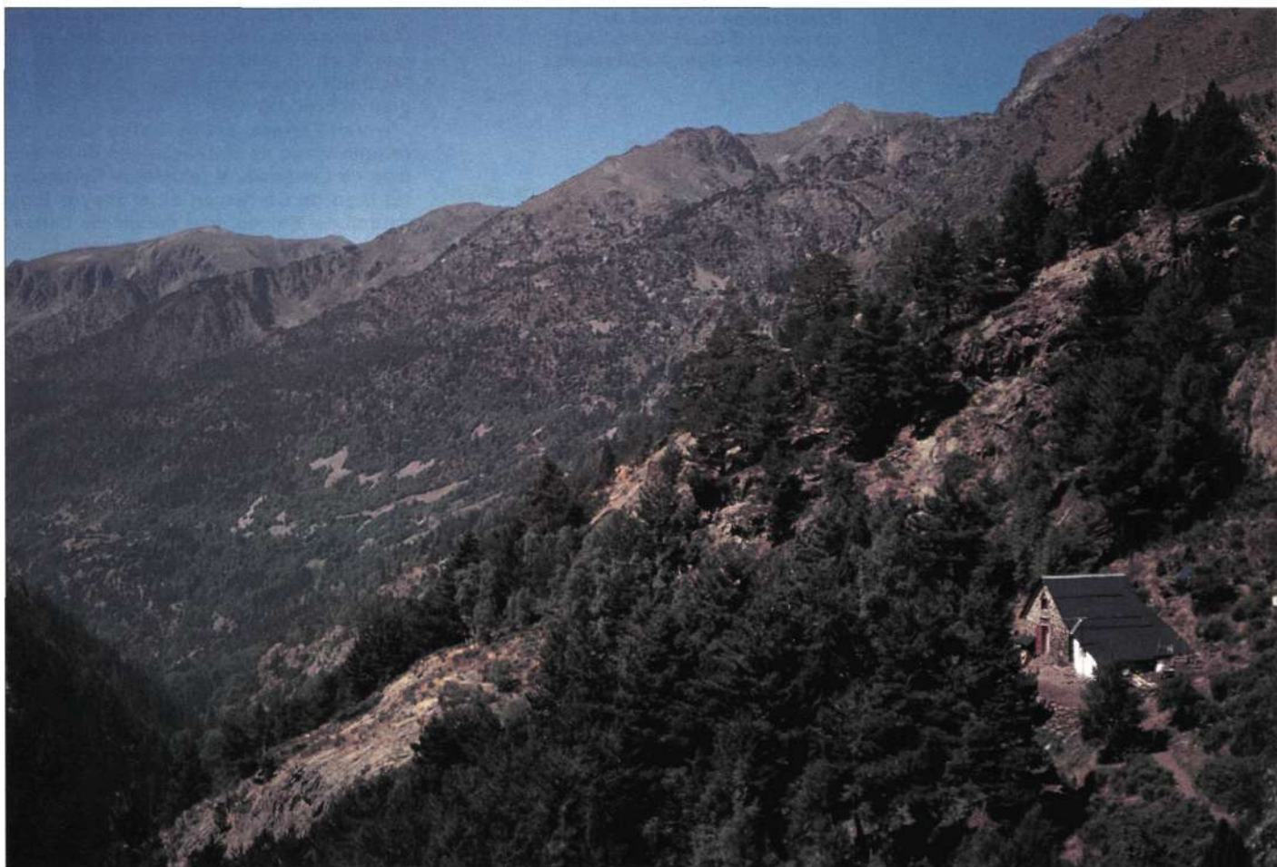
Estratégica situación del refugio Vallferrera a una altitud de 1.940 m., enclavado en el barranco de Areste.