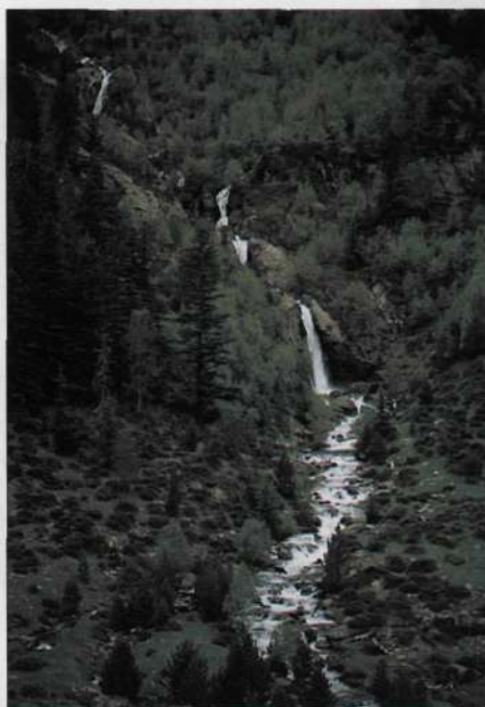
En primavera el agua del deshielo se apodera de todo el valle.

Vista de la cabecera de la Vall Ferrera desde el macizo del Gerri. A la derecha sobresale la Pica de Estats y abajo a la izquierda el pla de Boet.