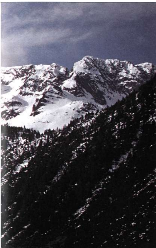
Panorámica invernal del macizo del Gerri (2.860 m.) desde el refugio Vallferrera.