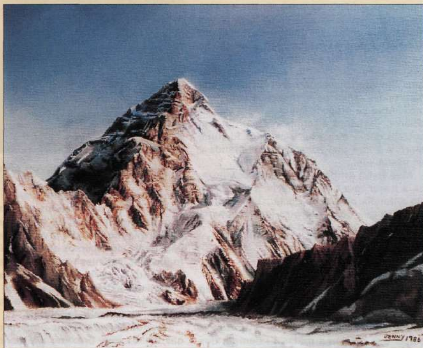
El K2. Cuadro al óleo pintado por Jenny