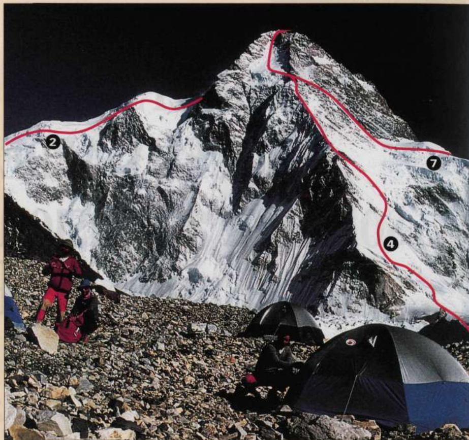
American Alpine Journal 1989

- La ruta n.º 3 (vasca) se había ascendido con anterioridad hasta su emplame con el "Hombro" de la Cresta de los Abruzzos (ruta italiana) e incluso hasta la parte superior del llamado "Cuello de Botella", pero nunca hasta la fecha se había escalado en su totalidad hasta la cumbre.