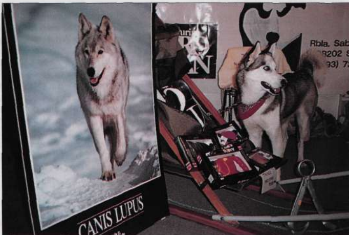
El stand de Expoaventura, donde la atención principal estuvo centrada, en los perros de trineo.

Los días 13 a 15 de mayo, el Pueblo Español de Montjuic, en Barcelona, fue la sede del primer certamen de Expoaventura en el que se dieron cita, entre otros, importantes alpinistas del Estado. Además de stands de firmas comerciales,