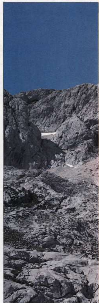
Flanqueo del murallón del Trave (desde la Campa del Trave).

de desnivel absoluto en unas siete horas y media; por tanto, en menos del doble podría plantearme también retornar al punto de partida. Sin más, un soleado día de julio emprendí la marcha con 15 horas de luz por delante y una mochila que, por si acaso, contenía: un recipiente de dos litros, comida para dos jornadas y equipo de vivac.