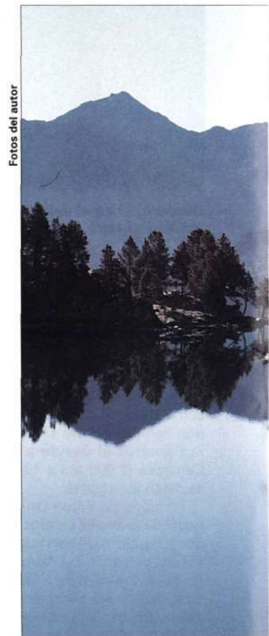
Reflejos en el lago de Naorte (2.160 m.).

Seguiremos el sendero aún visible junto a las pequeñas cascadas que forma el torrente y en la admiración de sus aguas