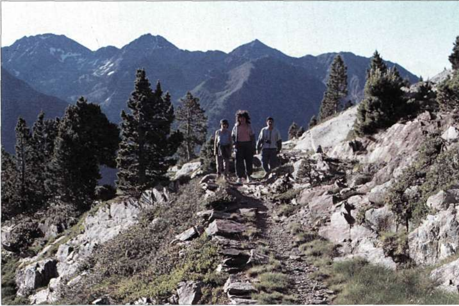
El antiguo y elevado camino del lago Naorte al Certascan.