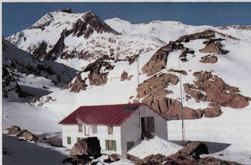
Refugio de Certascan a 2.240 m. recientemente reformado. Al fondo el pico Certascan (2.853 m.) y la punta Norte.

Aunque quizás el trabajo de guarda no sea del todo como en nuestros sueños, siempre he disfrutado con mi estancia en el refugio y a pesar de los muchos años pasados, todavía sigo saboreando los pequeños placeres que me aporta el entorno, la actividad, a veces la soledad y también la compañía de los excursionistas en estos PARAJES POR DESCUBRIR.