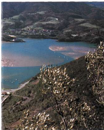
Ría de Mundaka. En primer término el camping de Kanala, al fondo Sukarrieta.

Kaixo! Somos un par de los cientos de excursionistas que a primeros de diciembre optamos por la montaña como medio para cambiar de "clavija" y olvidarnos de alguna forma del acoso de la rutina diaria.