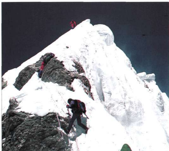
El momento clave en el "Escalón Hillary"

actor muy conocido; pero yo no tenía deseos de competencia. Al margen de la edad, allí, como todos los demás, yo estaba para subir a la cumbre".