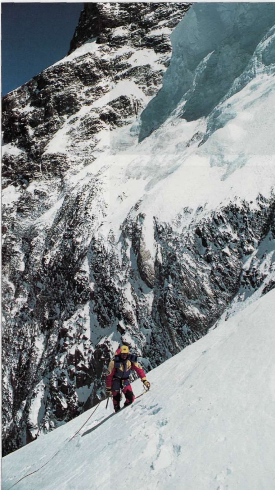
Hacia el C IV bajo el gran serac del K2 a 7.600 m

Hala ere, garaiz hartu zen erabakia. Hamabiak aldera, "Hau bukatu da" esanez, bueltako bidean ginela abisatu genien behekoie. "Lasai, poliki jaitsi, kontuz ibili, presarik ez dago ..." la aspertu arteko erretolika entzun genuen baina halako egoeran,