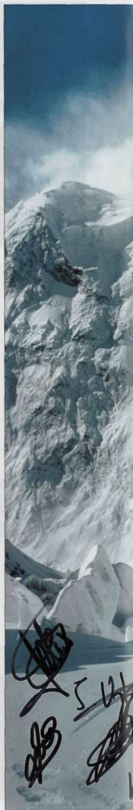
Itinerario seguido por la expedición al K2, firmado por los componentes de la misma

memoria freskatzeak ez du kalterik egiten.