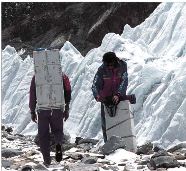
Porteando del CB al CBA

Deiak dei, informazioa noiz eta nola eman eztabaidatu eta gorako bidean ginen, base aurreratuaren bila. Horretarako, lehenbizi, kanpamendua bedeinkatu genuen, ohi legez jainkoei ere baimena edo beren onespena eskatzeko, baina ez dakit zuzen kunplitutako ote genuen; beharbada arroz edo irin gutxitxo eskaini genien, edo agian whisky botila ez zen goraino beteta iritsiko aldarera, edo nik dakit zer. Kontua da telefonoarekin beste dei bat baino ez genuela egin ahal izan, eta kitto. Kontxik botatako "kaka zaharra!!!" jainkoek entzungo zuten, bai horixe, baina gure ibileren seinalerik ez zen berriz etxe aldera iritsi.