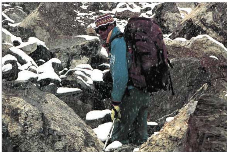
Del CBA hacia la pared, en un camino de dos horas (en la pág. de la izquierda)