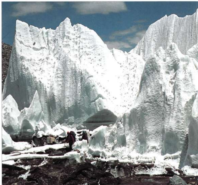
Porteando del CB al CBA en el tramo donde cruzamos el glaciar, entre las torres de hielo