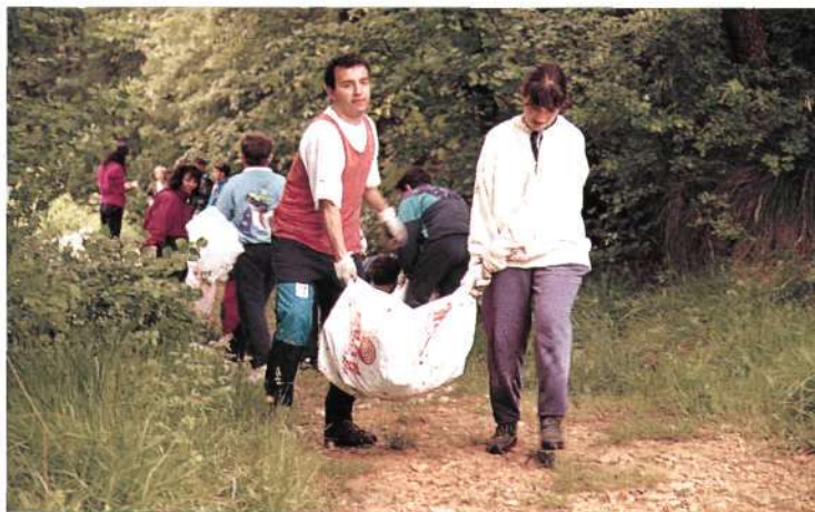
Cinco de Junio. Día Mundial del Medio Ambiente.

Macizo del Gorbea con la gratuita intención de recoger las basuras que desde hace muchos años "adornan" este enclave. La proliferación de basuras era muy evi-