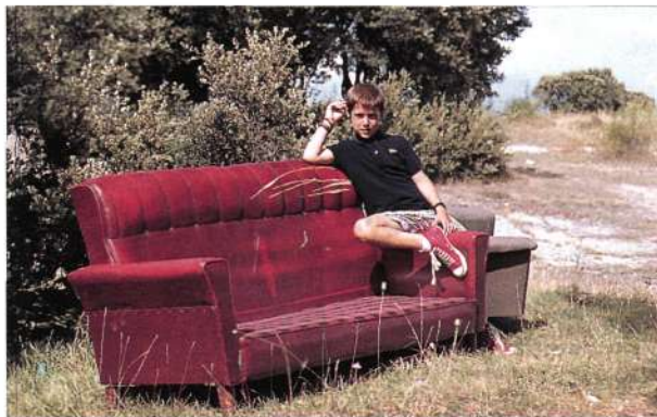
En el monte podemos encontrar todo tipo de cosas.

Los montañeros alaveses tuvimos la ocasión de contemplar hace unos meses que todo lo que a lo largo de este artículo se ha venido exponiendo responde perfectamente a la realidad. Fue así que nos dirigimos al