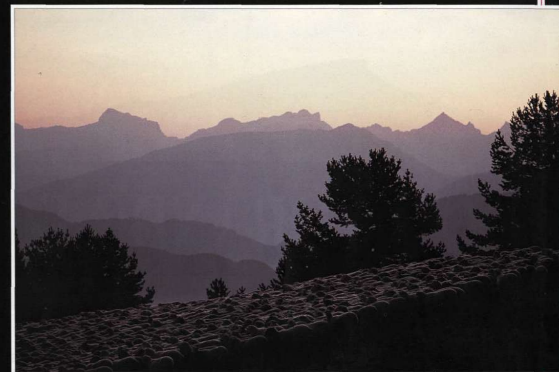
La transhumancia en el alto de Lazar