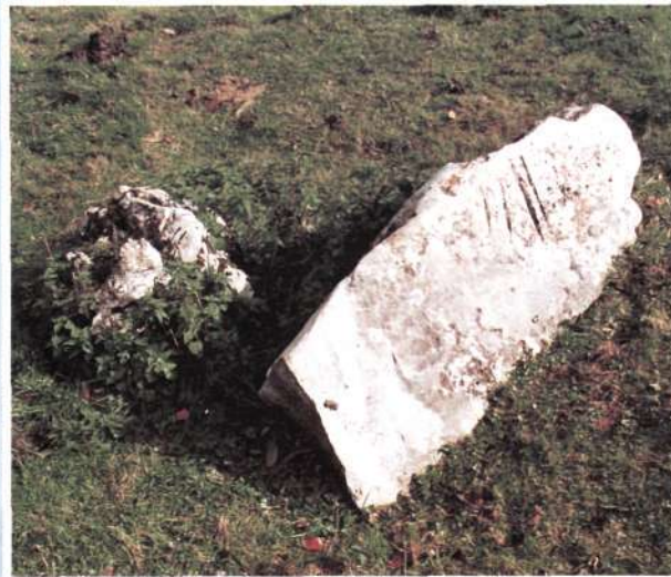
Erroldan menhir-a puskatuta. Men (harria) hir (luzea)

hornituriko bideari jarraitzen diogu, gorantz, norabidea aldatu gabe. Aisa egiten den bide honek Ata bailara gurutzatuko du, antzina, inguruko herritarren nahien arabera, helmuga jakin bat zuelarik: San Miguel in Excelsis, Altxueta (1.343 m.) mendiaren alboan dagoen eliza, alegia. Hortaz, bide zaharra dugu honako hau, zenbait bitxikeriaren lekuko.