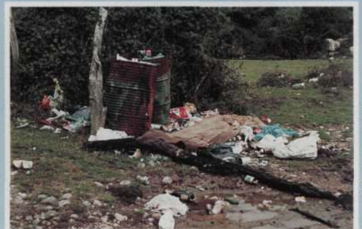
Urruntzurre errekatik gertu. Arbuia garria da zenbaiten naturarekiko errespetu eza.

Haizearen fereka mugatik mugara eguzkiaren izpiak uxatuz. Hostoaren irristada zuhaitzak biluziz ... Txoria! Zure laguna tiroz hil dute. Ihes egin! Gordeleku apropos bat aurki ezazu! Babes zaitetz Atako pagadietan.