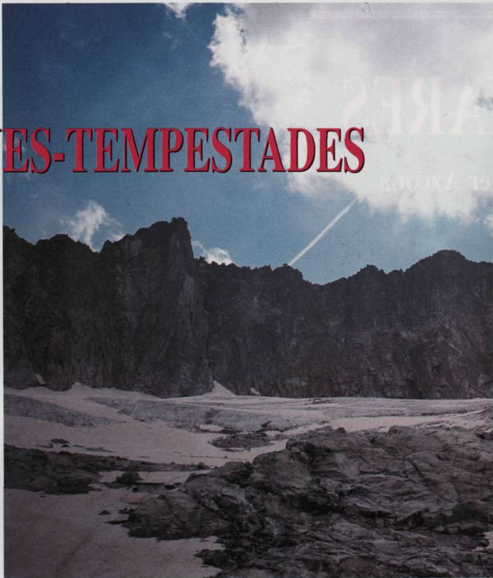
Desde el glaciar de Tempestades, la arista de Salenques.

La lejanía del collado de Salenques y su larga marcha de aproximación desde la Renclusa hace muy difícil realizar esta vía sin ir preparado para vivaquear.