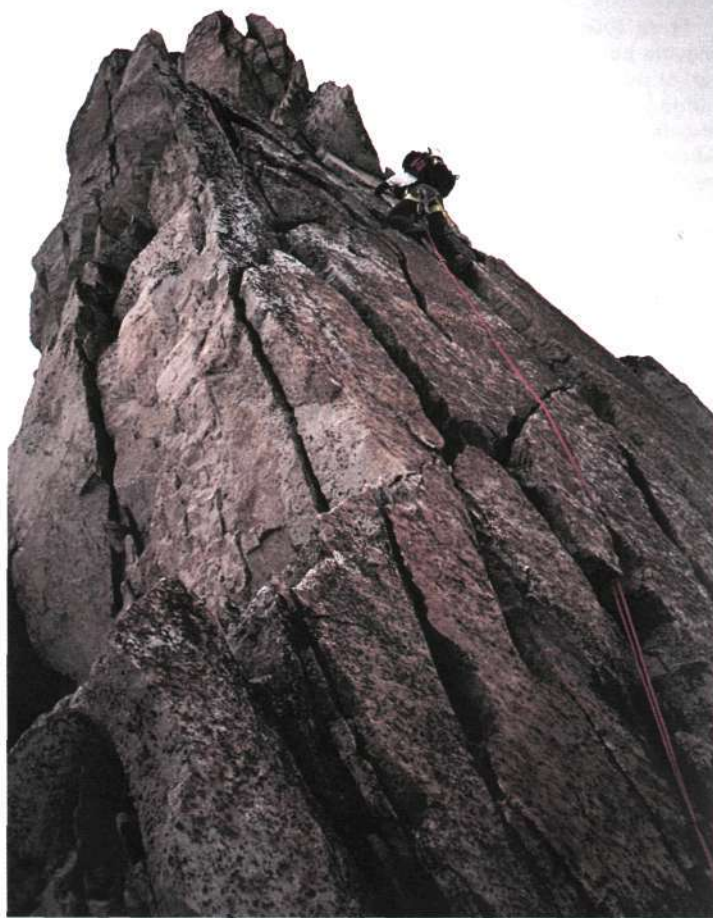
Julio en el primer gendarme (IV inf).