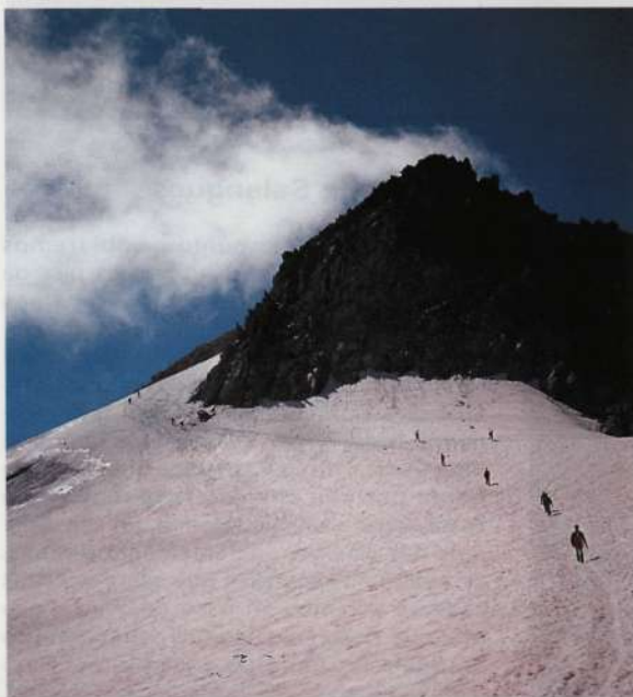
Desayunando en el Pico Tempestades, al fondo el pico Russell.