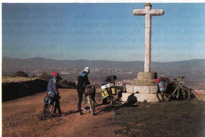
Diversas imágenes de nuestro periplo a través del Camino de Santiago.

un rato y verlos, como Frómista o Carrión de los Condes. Sahagún era nuestro destino de ese día. Esta etapa, la mayoría de su recorrido lo hemos realizado por monte. Una gozada.