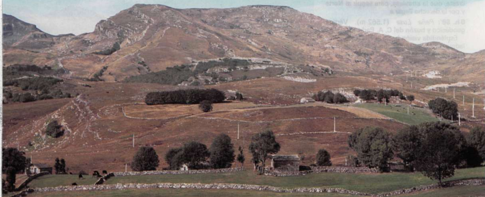
Pico de la Miel sobre el circo de la Lunada donde se ubica la estación invernal.