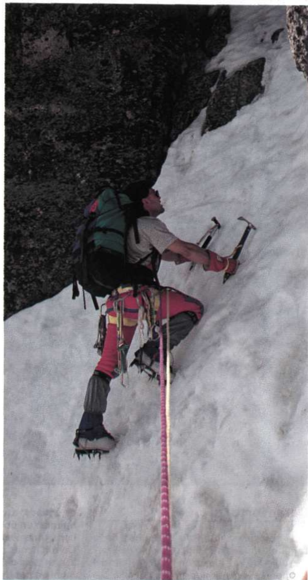
Escalando el Diedro Esteras.