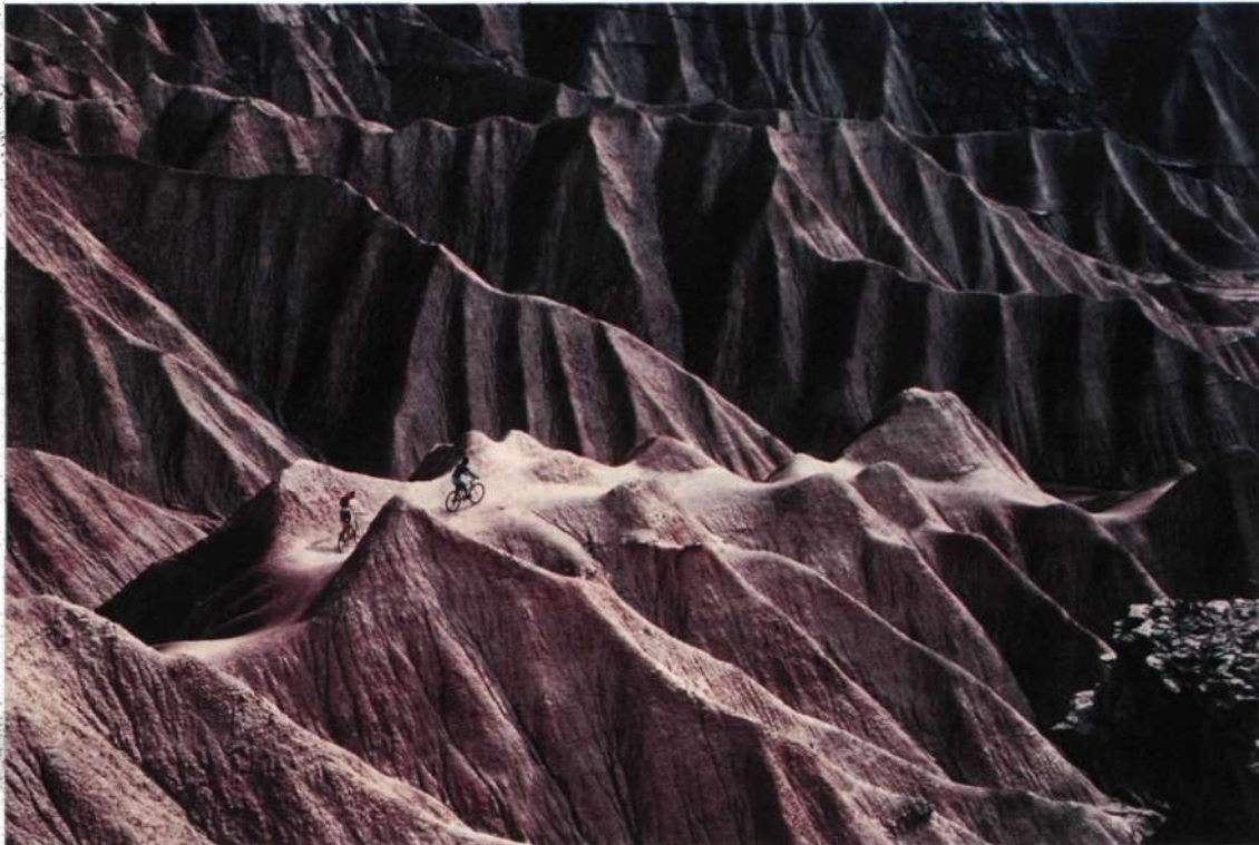
La arista bonita.