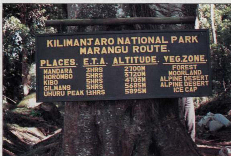
Cartel al comienzo de la ruta normal.

E STE artículo es la segunda parte de un trabajo más completo preparado sobre el techo de África. El trozo anterior se refiere a los principales aspectos de la geología, glaciario, fauna, flora y clima de esta montaña y puede ser solicitado por los interesados al autor, a través de Pyrenaica. Ahora se ofrece un aspecto más práctico como puede ser la descripción de los diferentes itinerarios y demás observaciones de utilidad para el que quiera acudir al Kilimanjaro. Se finaliza con una orientación bibliográfica.