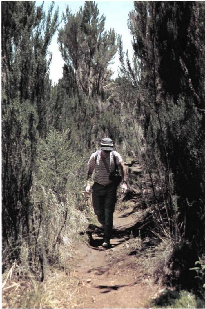
Llegando a Mandara Hut (2.700 m.) entre brezos gigantes.