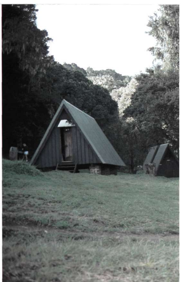
Mandara Hut, el más puro estilo noruego en el África negra.