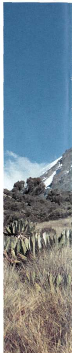
Paseando entre lobelias a 4.000 m. con el Kibo al fondo.

(41 km.), el autobús vale 40 TSh, y de Marangu a la puerta del parque (Marangu Gate) no hay línea regular, por lo que hay que ir a pie (5 km. cuesta arriba), en vehículo particular o en matatu. A nosotros nos pidieron 2.000 TSh y pagamos finalmente 400 TSh. Sabemos de quien ha pagado 30 TSh, pero también ha habido quien ha soltado 50 $.