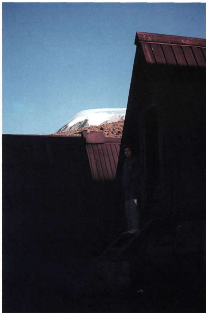
La cima del Kibo en un amanecer desde Horombo Hut (3.750 m.).

— Ruta Loitokitok. Parte de Kenya y por problemas políticos entre los dos países se encuentra cerrada o prohibida. Existe la posibilidad de pedir un permiso especial al parque (prever varios días de papeleo) para lo cual es necesario ir a Marangu y pagar. Es difícil obtener porters. Desde Outward Bound School, seguir la senda hasta la carretera y girar a la izquierda hasta alcanzar el puente que cruza el río Kikelewa. 150 m. más adelante hay un camino un tanto escabroso que cruza una plantación de coníferas, seguirlo hasta el final. Cruzar otra vez el Kikelewa y seguir por la selva hasta la zona de brezos o «moorland». A unas 2 horas encontraremos unas cuevas, a partir de donde giraremos suavemente hacia el Este, en dirección a The Saddle. Existe un enorme peñasco, Bread Rock, que sirve de referencia. El camino se divide aquí, a la derecha,