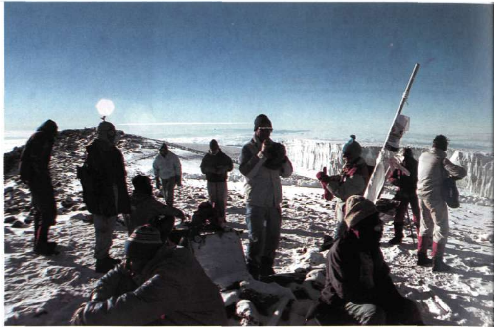
7 horas del 6 de octubre de 1989 en Uhuru Peak, centenario de la primera ascensión hecha el mismo día de 1889 por el austriaco Hans Meyer. Nosotros aparecimos en esa fecha por casualidad, no así una delegación diplomática de austriacos que son la mayor parte de los que aparecen en la fotografía.