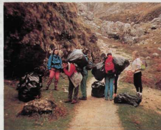
Resultados de la campaña de limpieza del Cares y camino de Bulnes.

En noviembre de 1989, el Colectivo organiza una campaña de limpieza en los Picos de Europa, escogiendo como zona la Ruta del Cares y la travesía Sotres-Pandébano-Bulnes-Poncebos, de donde se sacó más de una tonelada de basura. En esta actividad, como en otras, se pretendió a la vez denunciar ciertas posturas de las Administraciones