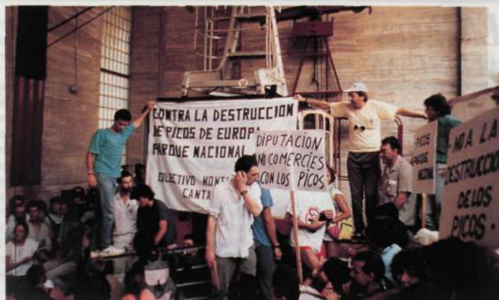
Paralización del teleférico durante el acto de protesta en Fuente De.