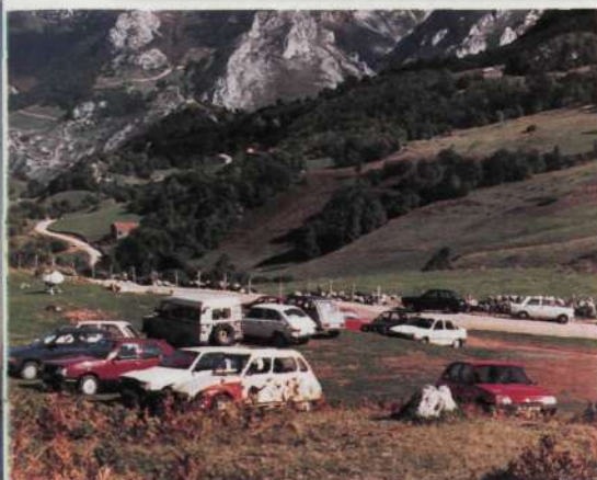
Aspecto parcial de los coches invadiendo las praderas en las inmediaciones de Pandébano tras haber subido por la pista de uso «exclusivamente» agrícola.