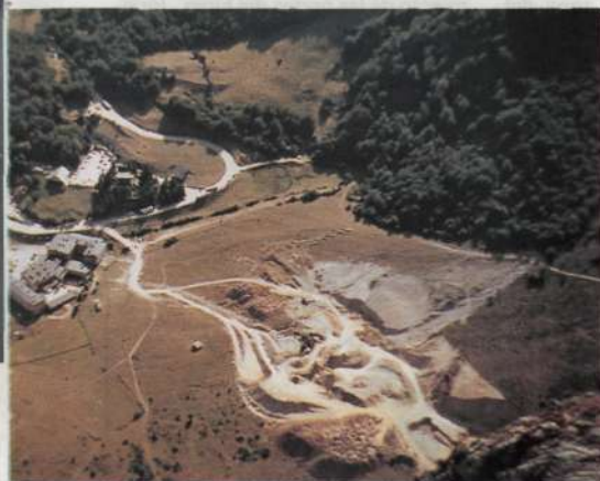
Estado en que quedó Fuente De tras haberla convertido en «cantera de grava»

Croquis del Macizo Central de los Picos de Europa con las pistas ya realizadas (rojo y azul), el teleférico de Fuente De (rayado en negro) y los teleféricos proyectados (rosa y rayados).